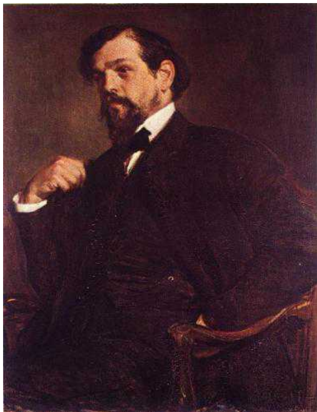
Клод Дебюсси (1862-1918)