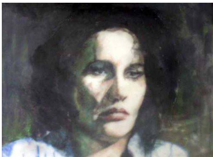
Предполагаемый портрет Анны Гёлди