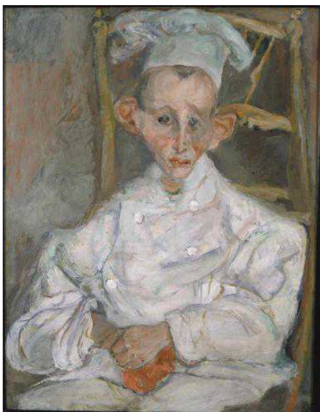
Хаум Сутин "Кондитер г. Кань", 1922/23

Другая история – о Хаиме Сутине, которого Вячеслав Кантор назвал отцом послевоенного экспрессионизма, с горечью отметив, что творчество этого художника до сих пор не получило достойной оценки. Известно, что Хаим Сутин умер в 1943 году в Париже. Но где он похоронен? Этот вопрос не давал покоя Вячеславу Кантору в течение многих лет. И вот не так давно он нашел место захоронения Сутина – на кладбище Монпарнас есть могила без имени, лишь с датами рождения и смерти и с крестом. Почему так? По мнению г-на Кантора, таким образом друзья Сутина, а на его похоронах был и Пикассо, хотели оградить могилу Хаима Сутина от возможного осквернения нацистами.