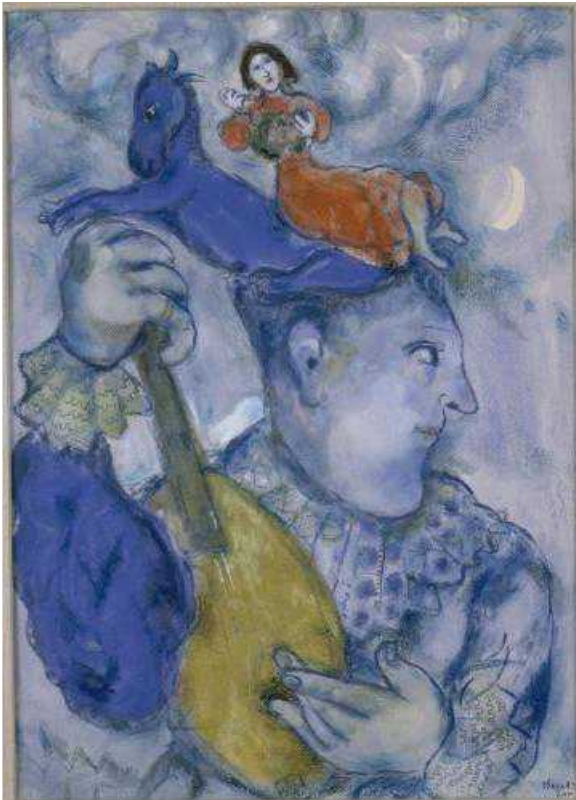
Марк Шагал "Клоун-музыкант", 1937-1938 гг.