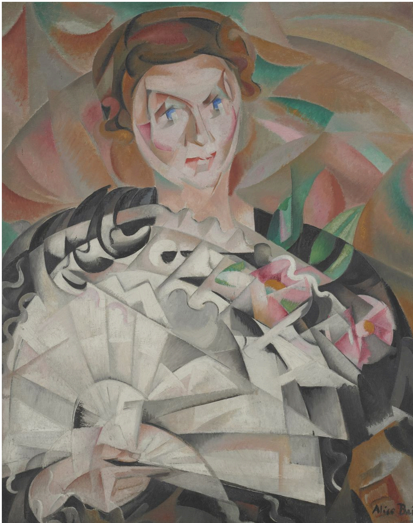
Алис Байи. Игра с веером, или Женщина с веером.

В 1906 году она обустраивается в Париже, в так называемой «швейцарской колонии», и знакомится с такими художниками, как Куно Амье, Соня Делоне, Рауль Дюфи, Мари Лорансен, увлекается сначала фовизмом, затем футуризмом, кубизмом, дадаизмом... Успехи Алис Байи были таковы, что она трижды удостоивалась