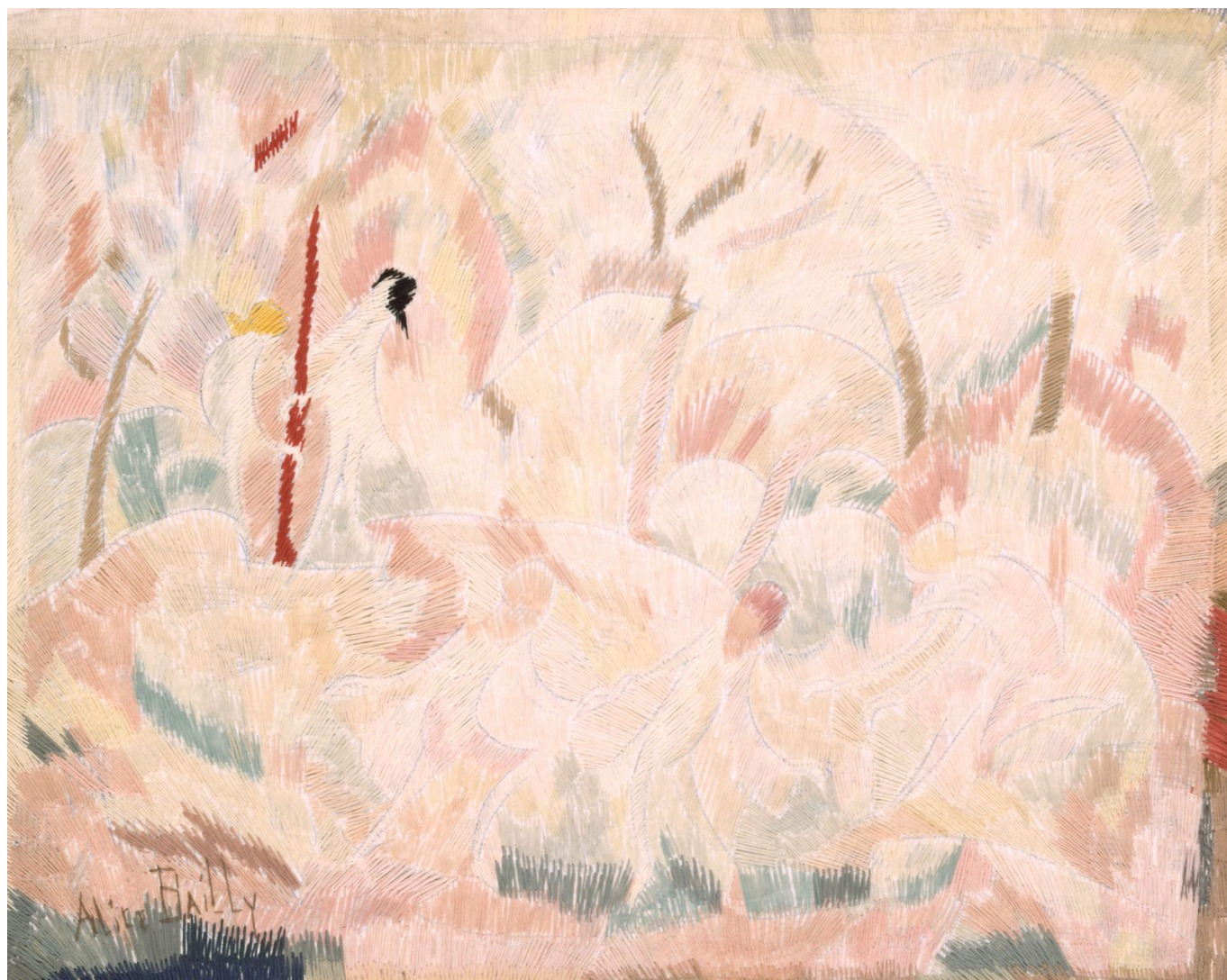
Алис Байи. Розовая весна, 1917 г.

А продавались они успешно. Впервые художница показала публике свои произведения в 1900 году, затем участвовала в парижских «Салоне независимых художников» и Осеннем салоне, в 1913 году провела персональную выставку в Музее Рата в Женеве, выставлялась в Мюнхене, Берне, Невшателе, Кунстхаусе Цюриха, в Афинах... Согласно информации, размещенной на сайте Национального музея «Женщины в искусстве» в Вашингтоне, где тоже хранятся ее работы, в 1912 году она была отобрана для представительства Швейцарии в рамках передвижной выставки, посетившей Россию, Англию и Испанию, а в 1926 году получила Премию Венецианской биеннале.