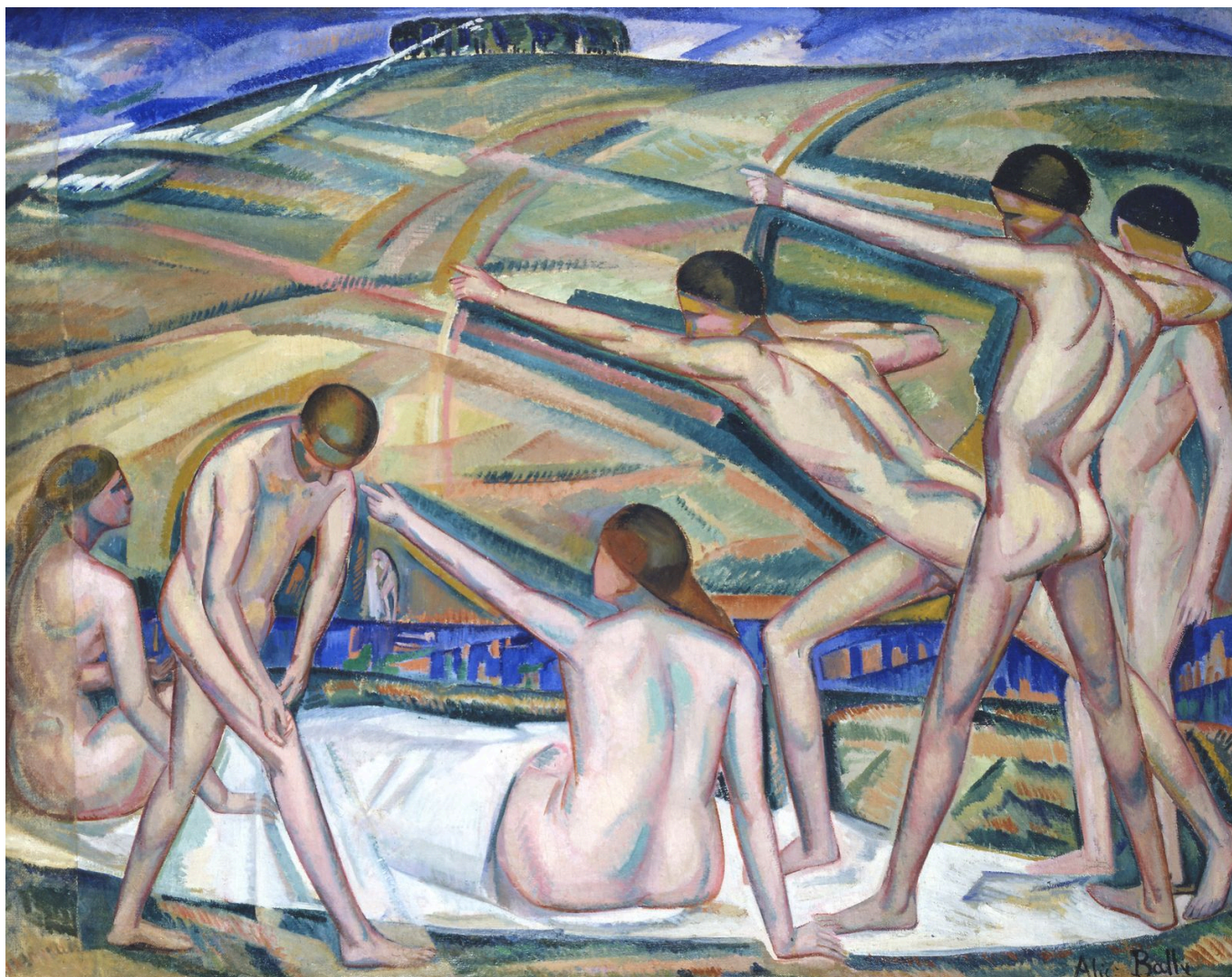
Алис Байи. Стрелки из лука, 1911 г.

В двух залах исторического здания музея, в корпусе Мозера, неподалеку от выставки « Шедевры на бумаге от Альбрехта Дюрера до Дитера Рота », представлены 22 работы Алис Байи: масляная живопись, рисунки и знаменитые «шерстяные картины», которые сегодня считаются важной вехой швейцарского модернизма.