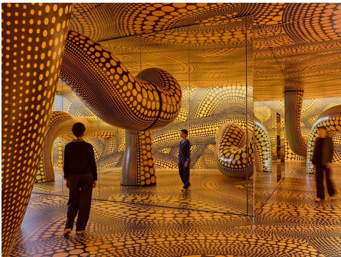
Инсталляция Infinity Mirrored Room – The Hope of the Polka Dots Buried in Infinity Will Eternally Cover the Universe, 2025 © YAYOI KUSAMA

Автора этих строк больше всего впечатлили, пожалуй, гигантские полотна Кусамы, расписанные невероятным количеством точек или, вернее, сверху донизу ими заполненные. На создание этих работ, ознаменовавших кардинально новый этап в ее творчестве, художницу подтолкнуло путешествие через океан, когда она в конце 1950-х годов, бросив свою обеспеченную, но неблагополучную семью, отважно полетела из родной Японии в США, чтобы лично познакомиться с вдохновлявшей ее Джорджией О'Кифф, выставка которой проходила здесь же, в Фонде Бейлера, три года назад . В Соединенных Штатах Кусاما тогда задержалась на полтора десятка лет, став важнейшей фигурой местной художественной сцены и впервые прославившись своими перформансами, хеппенингами, протестными акциями (в том числе с сжиганием советского флага), живописью, скульптурами, ассамбляжами и изготовлением моделей одежды.