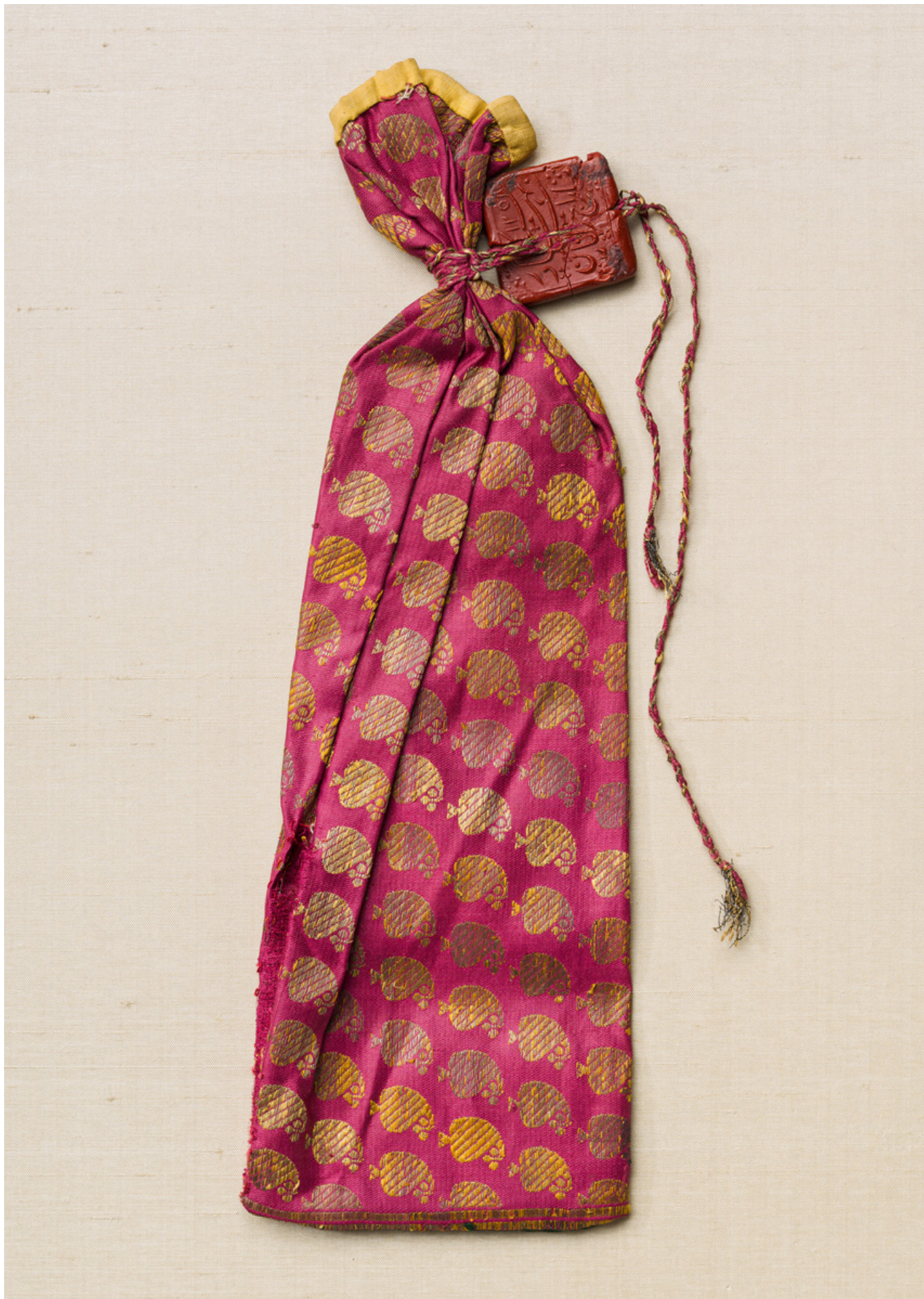
Шелковый мешочек для писем. Северо-западная Индия (Раджастхан), 1-я половина XIX века. Шелк и металлические нити, сургуч. Фонд Абегг, инв. № 6021a