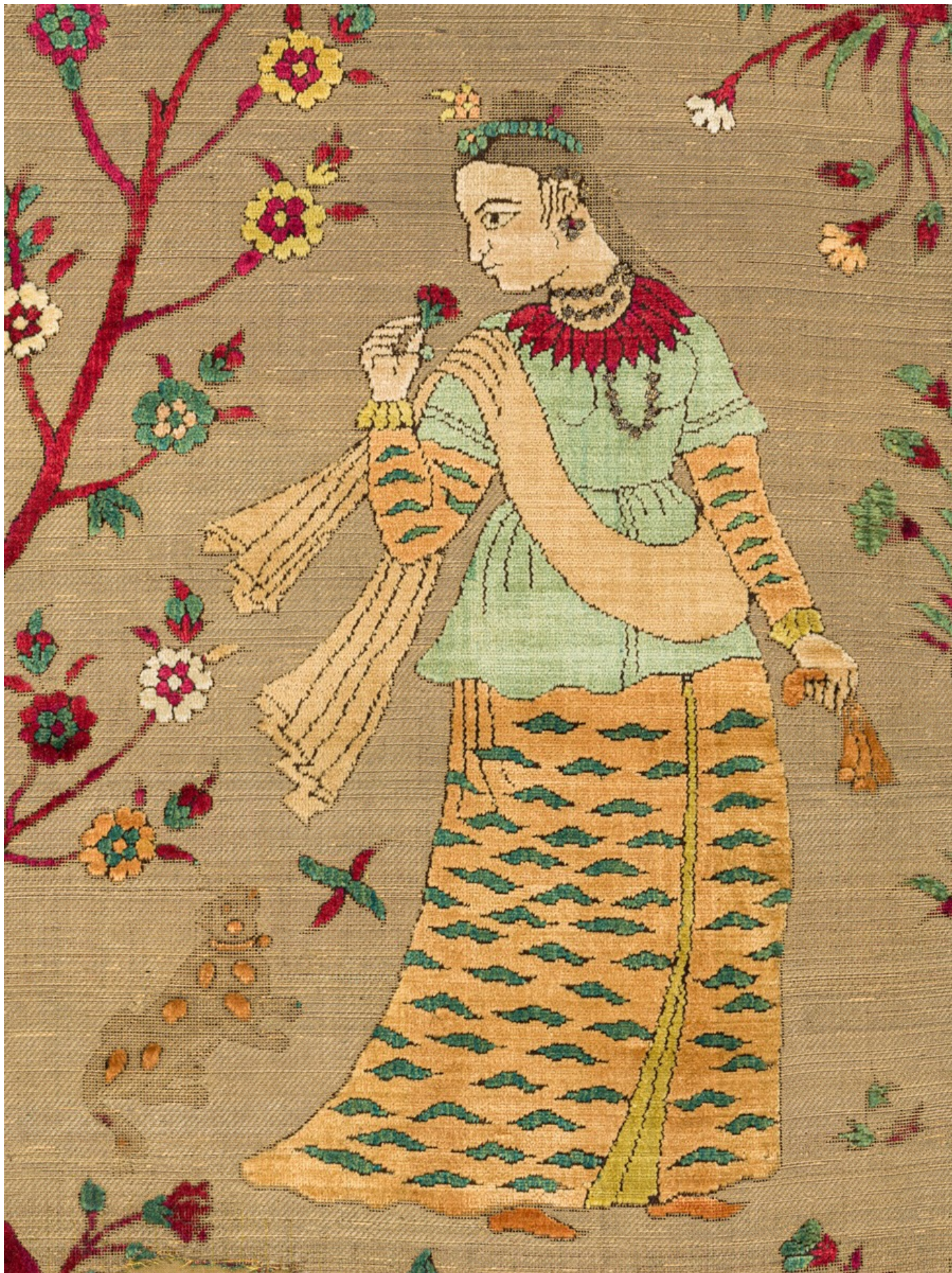
Бархатная ткань с изображением дамы в саду. Западная Индия (Гуджарат), начало XVII века. Шелк и металлические нити. Фонд Абега, инв. № 437