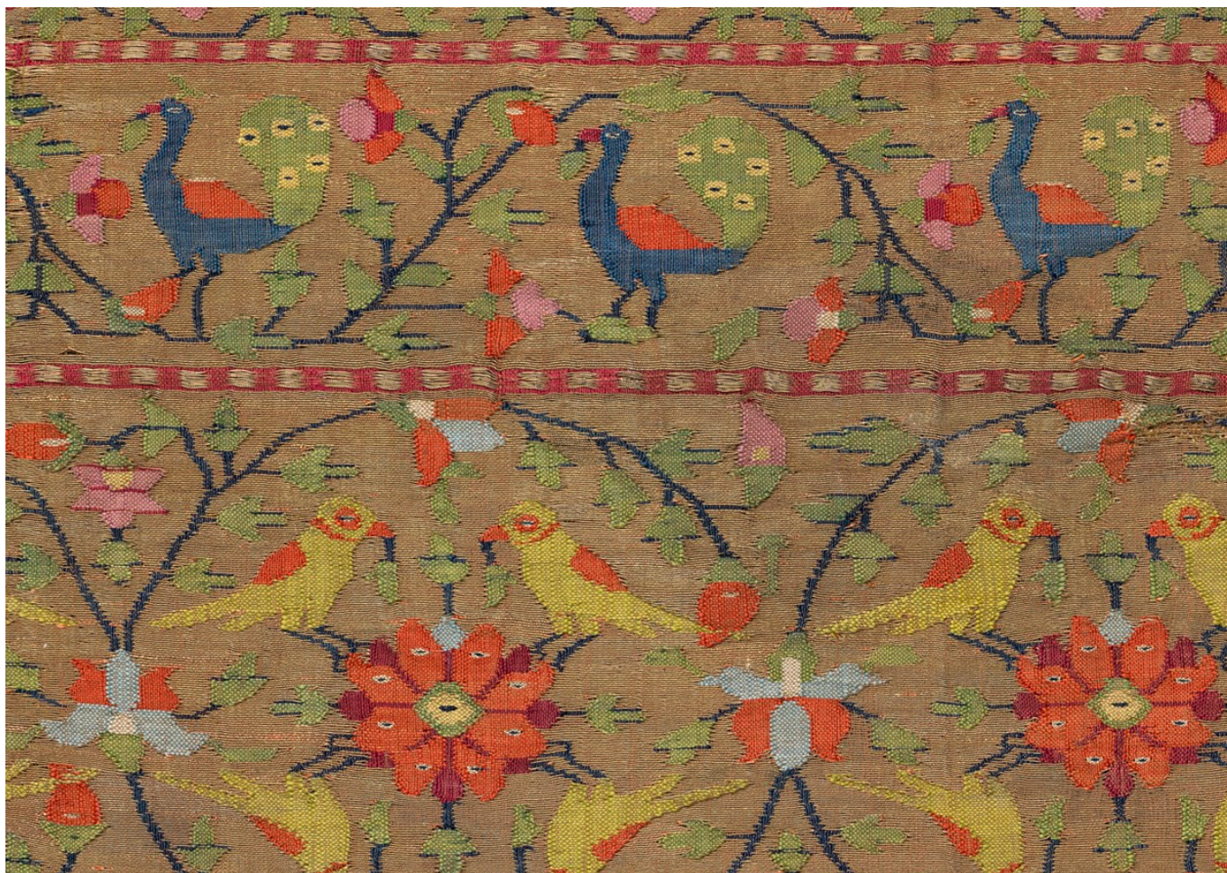
Кайма с павлинами и попугаями. Западная или Центральная Индия, середина XIX века. Хлопок, шелк и металлические нити. Фонд Абегг, инв. № 1540

Что касается индийской одежды эпохи Великих Моголов, то на выставке представлены два экземпляра XVIII века – шарф и пояс из шелка с богатым узором. Оба настолько длинные, что их пришлось свернуть! Они относятся к числу самых сложных с точки зрения техники ткачества текстильных изделий, поскольку сотканы из одного куска ткани с различными узорами для центральной части, боковой каймы и декоративных полей на концах. Разглядывать красочных павлинов и попугаев среди цветочных лоз невероятно интересно. В целом, индийские ткачи черпали вдохновение в природе, но затем превращали природные образцы в фантазийные художественные формы, которые соответствовали изысканному вкусу придворного общества. Такие драгоценные пояса и шарфы носили в основном принцы и высокопоставленные государственные служащие.