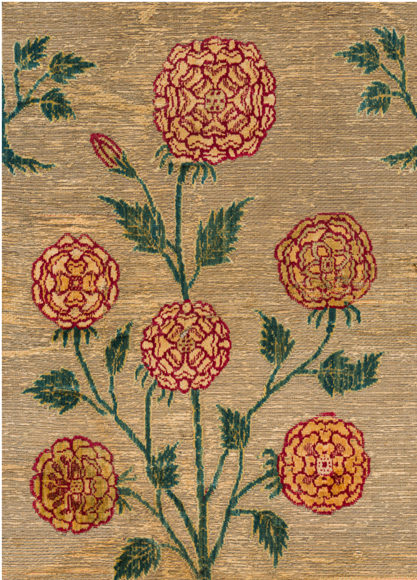
Бархатная ткань с цветочным орнаментом (фрагмент). Индия (Ахмедабад или Дели), середина XVII века. Шелк и металлические нити. Фонд Абега, инв. № 5802