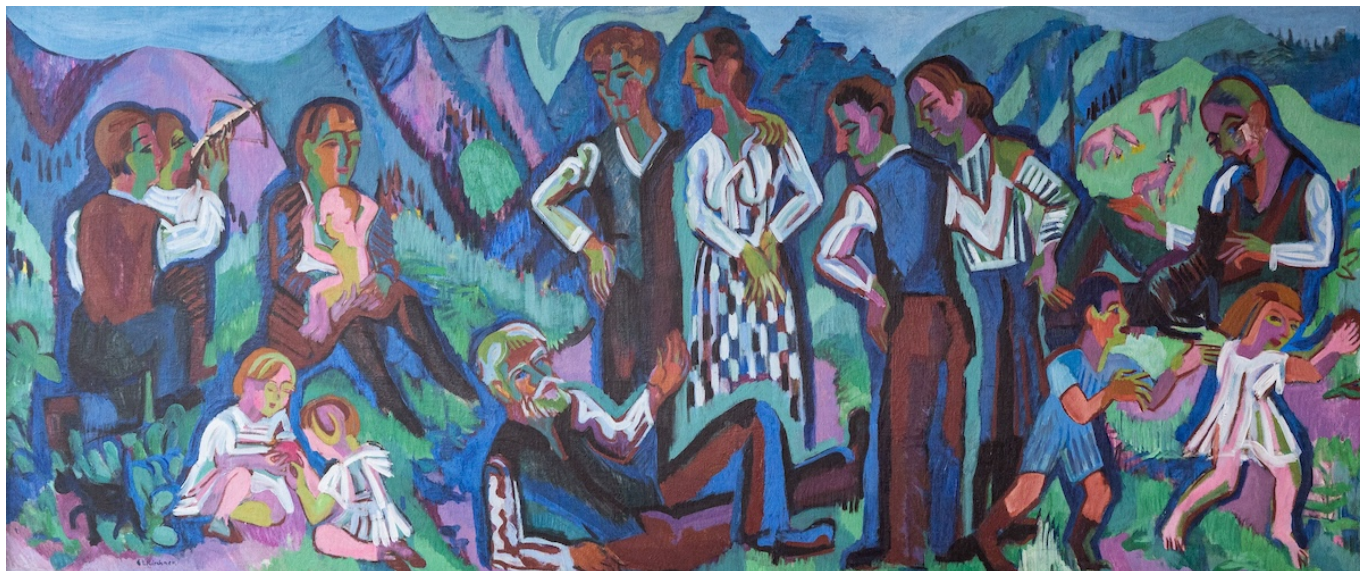
Эрнст Людвиг Кирхнер. Воскресенье горных крестьян, 1923-24/26.

Выставка «Kirchner x Kirchner», как и ретроспектива 1933 года, охватывает разные периоды творчества художника – от экспрессионистских начинаний в кругу группы художников «Мост» до поздних работ, созданных уже в Давосе. В нынешнюю экспозицию включены и работы, которые не были представлены в 1933 году, потому что Кирхнер сознательно их исключил или потому что они были недоступны. Такой подход позволяет лучше понять, какие решения принимал Кирхнер-куратор.