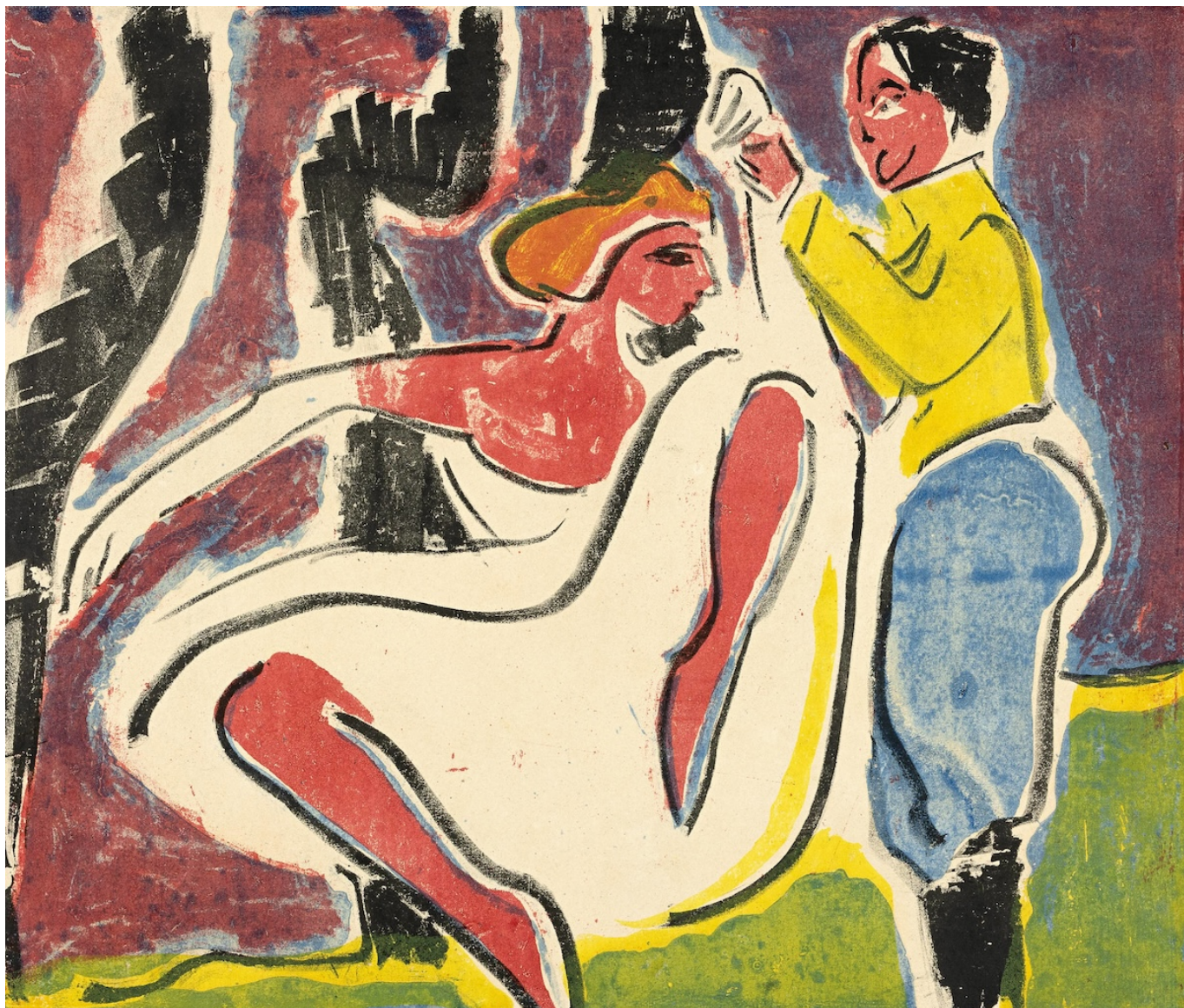
Эрнст Людвиг Кирхнер. Русские танцоры, 1909. Community of heirs Eberhard W. Kornfeld © Erbenegemeinschaft Eberhard W. Kornfeld

Автор: Заррина Салимова, Берн , 01.10.2025.