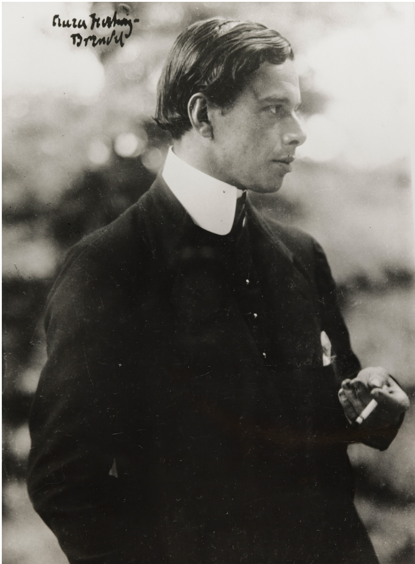
Аура Хертвиг-Брендель. Портрет Эрнста Людвиг Кирхнера, 1913/14. The Estate of Ernst Ludwig Kirchner © Nachlass Ernst Ludwig Kirchner, courtesy Galerie Henze & Ketterer, Wichtrach/Bern