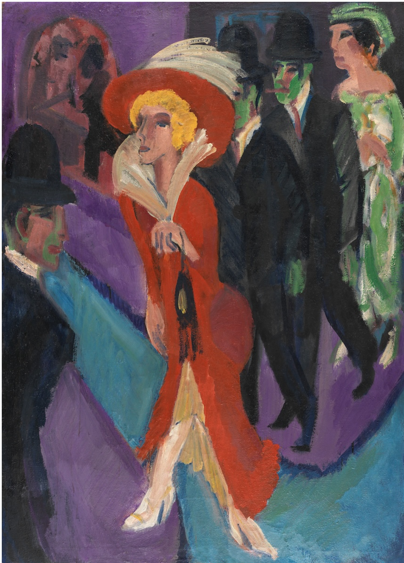
Эрнст Людвиг Кирхнер. Улица с красной кокеткой, 1914/25. Museo Nacional Thyssen-Bornemisza, Madrid