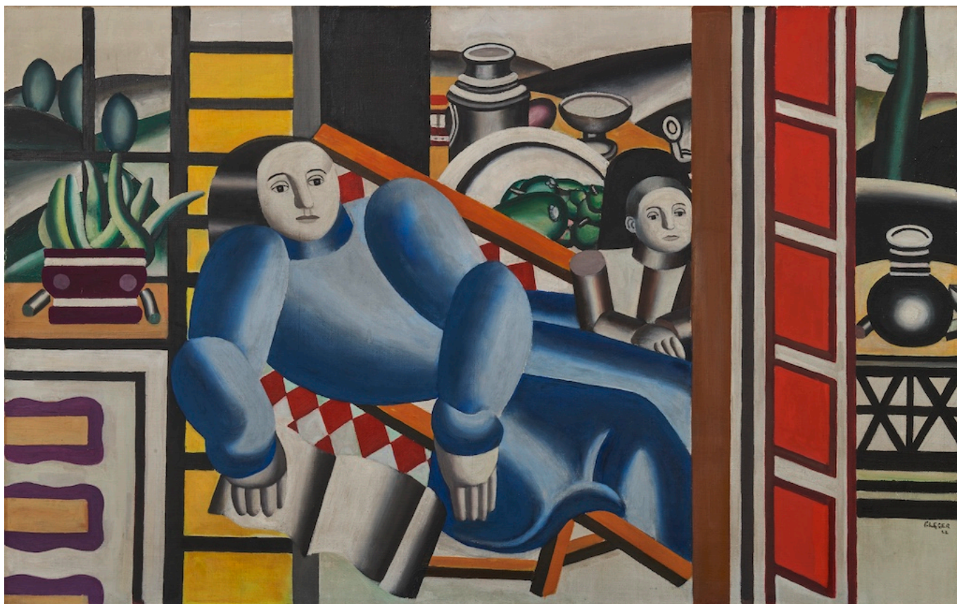
Фернан Леже. Чтение, мать и ребенок, 1922 г., Privatsammlung, Schweiz