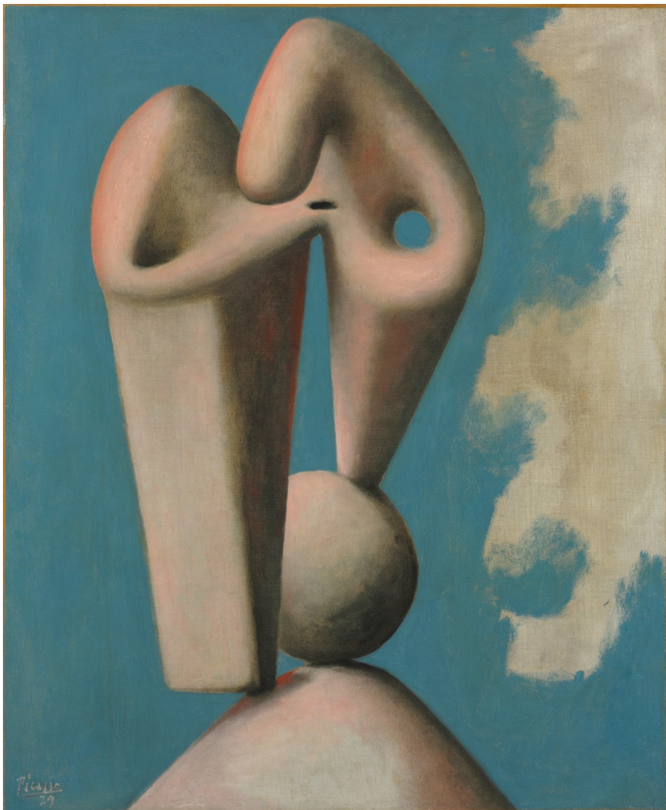
Пабло Пикассо. Голова: этюд для памятника, 1929 г., The Baltimore Museum of Art: The Dexter M. Ferry, Jr. Trustee Corporation Fund (BMA 1966.41) © Successió Picasso / 2025, ProLitteris, Zurich

Что касается собственно имен выставленных художников, то их перечень поражает воображение. Тут и несколько кубистических шедевров Пабло Пикассо и Жоржа Брака; и открывающий выставку дивный портрет кисти Андре Дерена; и кинетические скульптуры Александра Калдера; и абстрактные композиции Василия Кандинского; и целый зал, посвященный творчеству Жоана Миро; и всегда