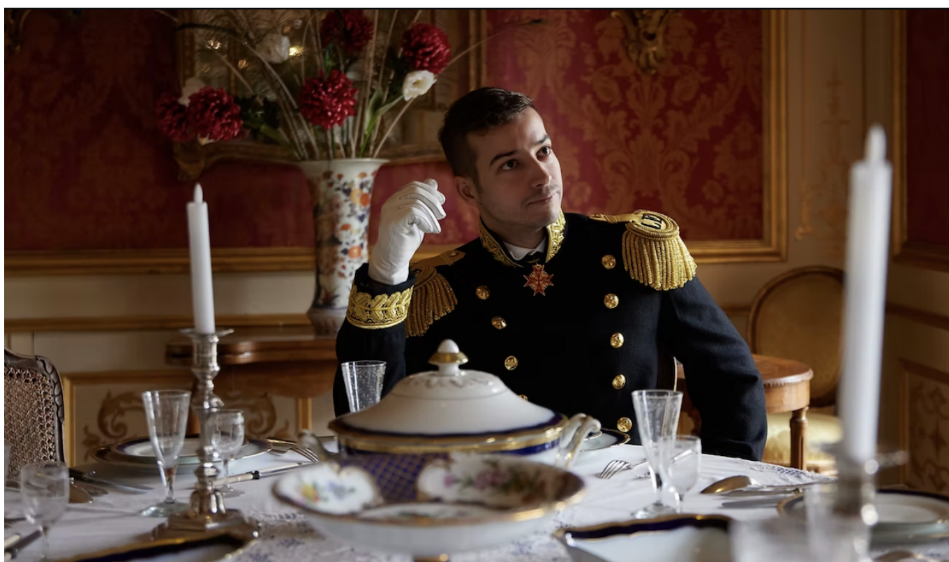
Фото с официального сайта «короля Швейцарии»

Автор: Заррина Салимова, Бургдорф , 07.08.2025.