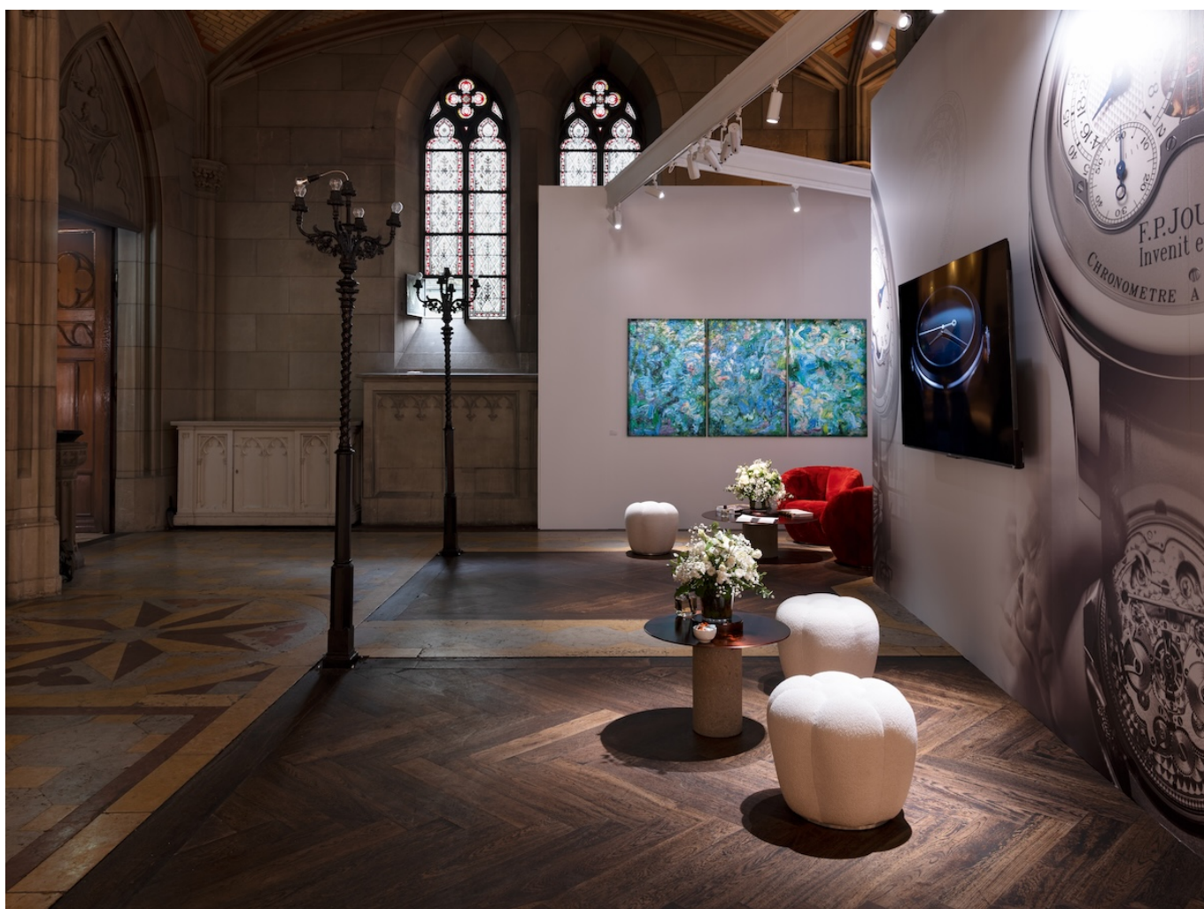
Стенд F.P. Journe на MAZE Design Basel. Фото: F.P. Journe

Автор: Заррина Салимова, Базель , 26.06.2025.