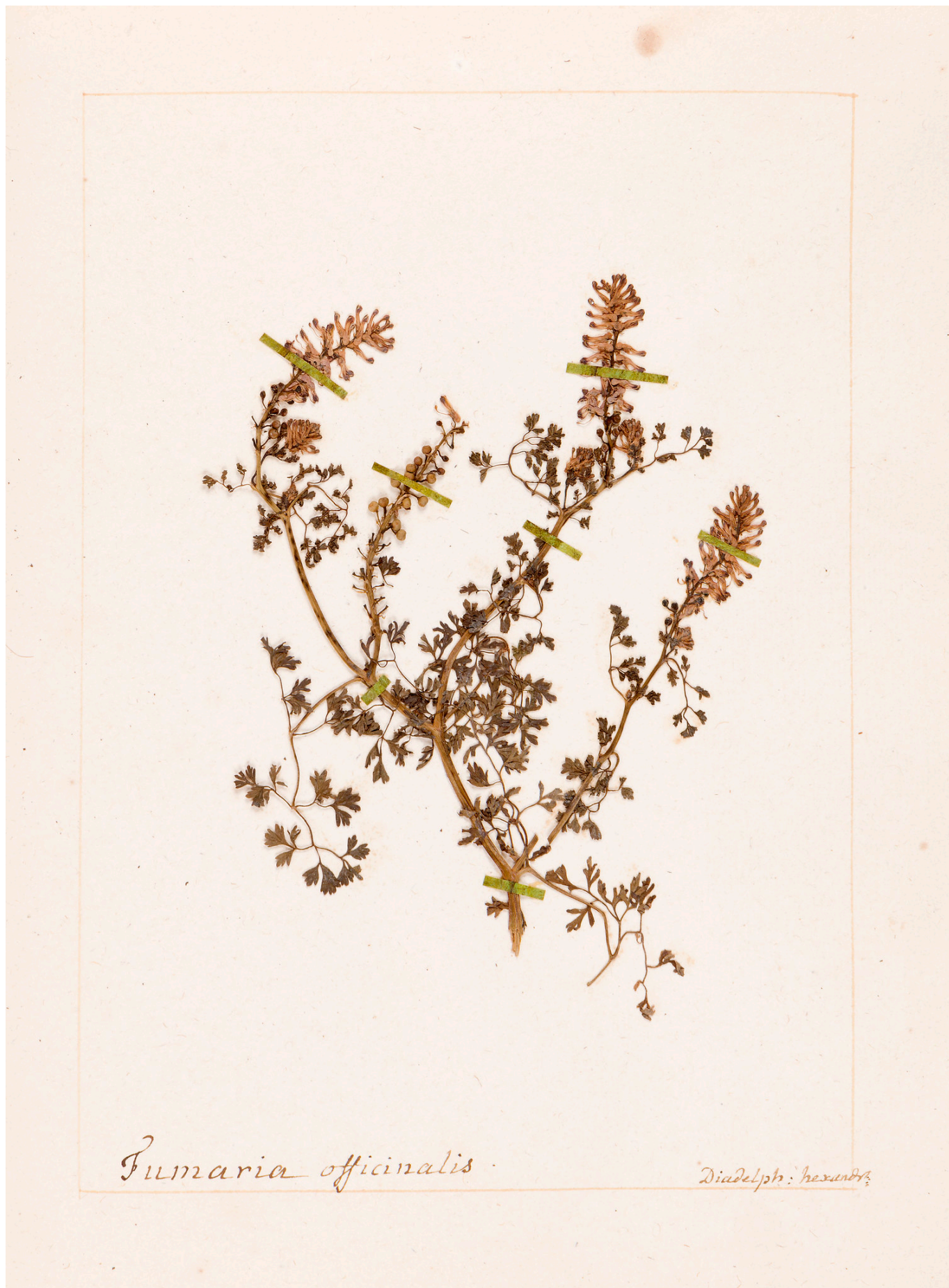
Один из листов гербария © Ader

Ален Баратон, главный садовник национального поместья Трианон и парка Версальского замка, превозносит достоинства этого гербария в видеоролике,