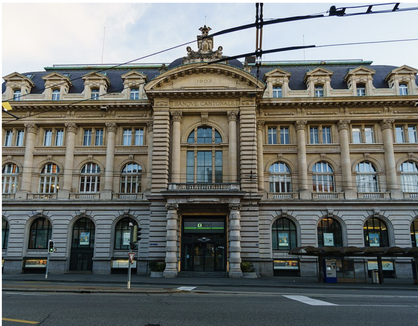
Здание Водуазского кантонального банка в Лозанне.

Автор: Заррина Салимова, Лозанна , 16.04.2024.