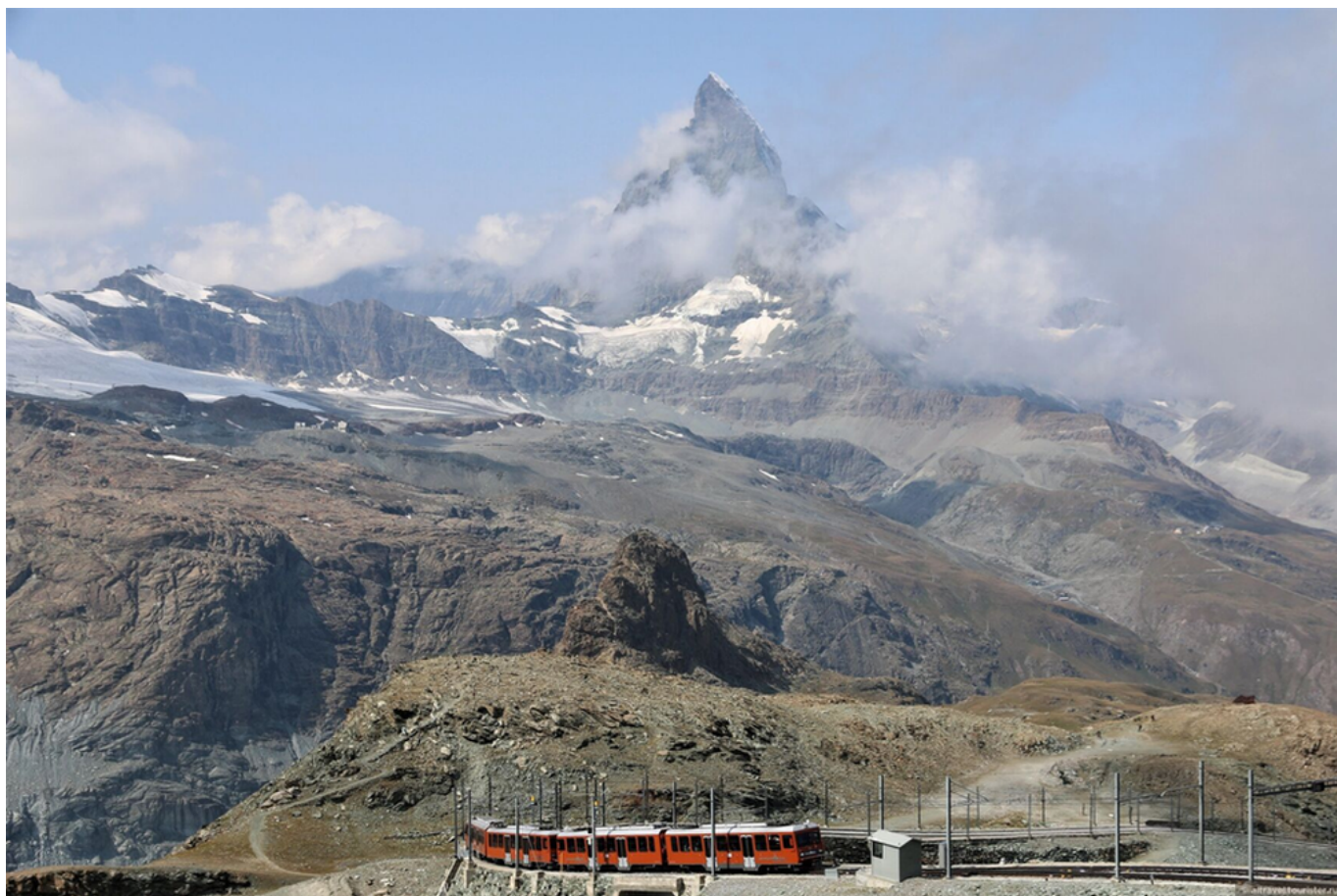
Железная дорога Гронергатбан

Автор: Наталья Беглова, Церматт , 28.05.2024.