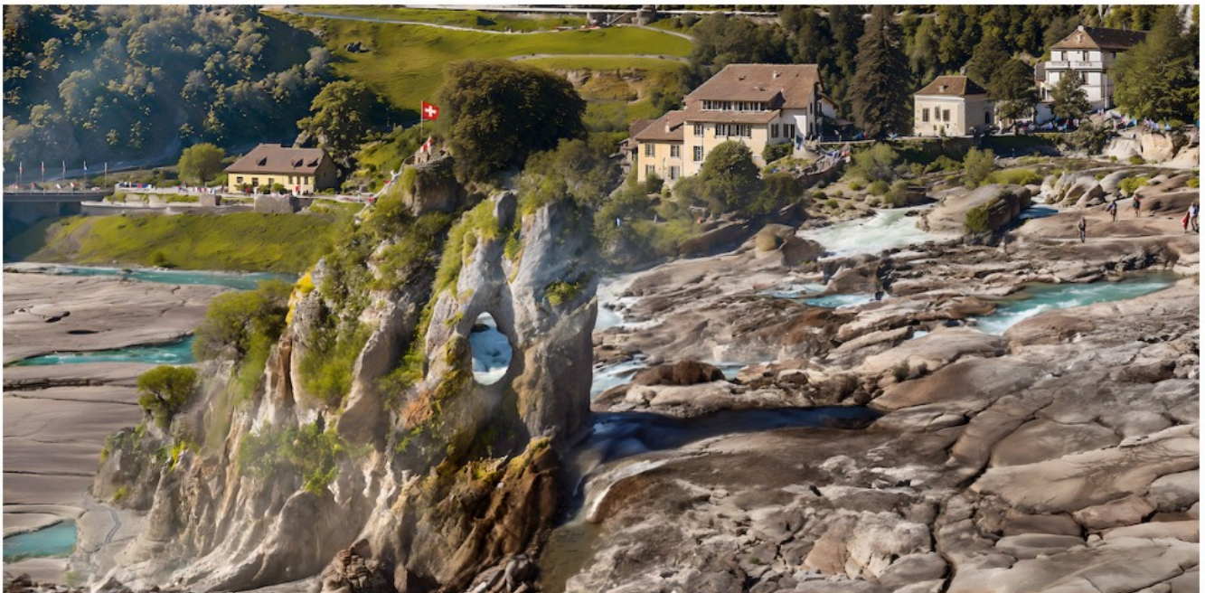
Рейнский водопад

Водуазским виноделам придется адаптироваться к изменению климата, поскольку выращиваемый в настоящее время в Лаво сорт шасла не выдерживает жары. Вместо винограда здесь будут расти оливковые деревья, которые лучше приспособлены к повышению температуры и засухе. Оставшиеся виноградные лозы придется часто орошать и защищать от солнца – это будет стоить дорого, поэтому такое вино будет доступно не каждому.