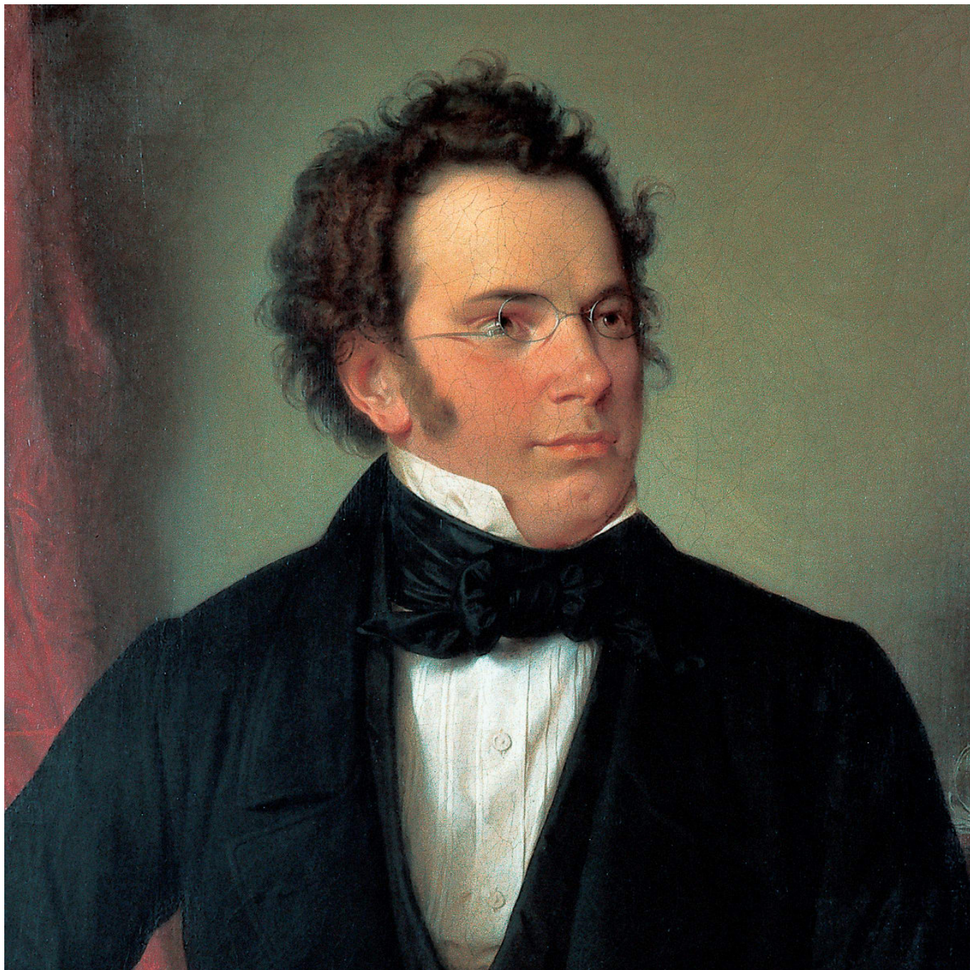
Вильгельм Август Ридер. Портрет Франца Шуберта, 1875 г.

Два камерных произведения великого австрийского композитора прозвучат в предстоящем концерте серии «Великие исполнители» агентства Caecilia.