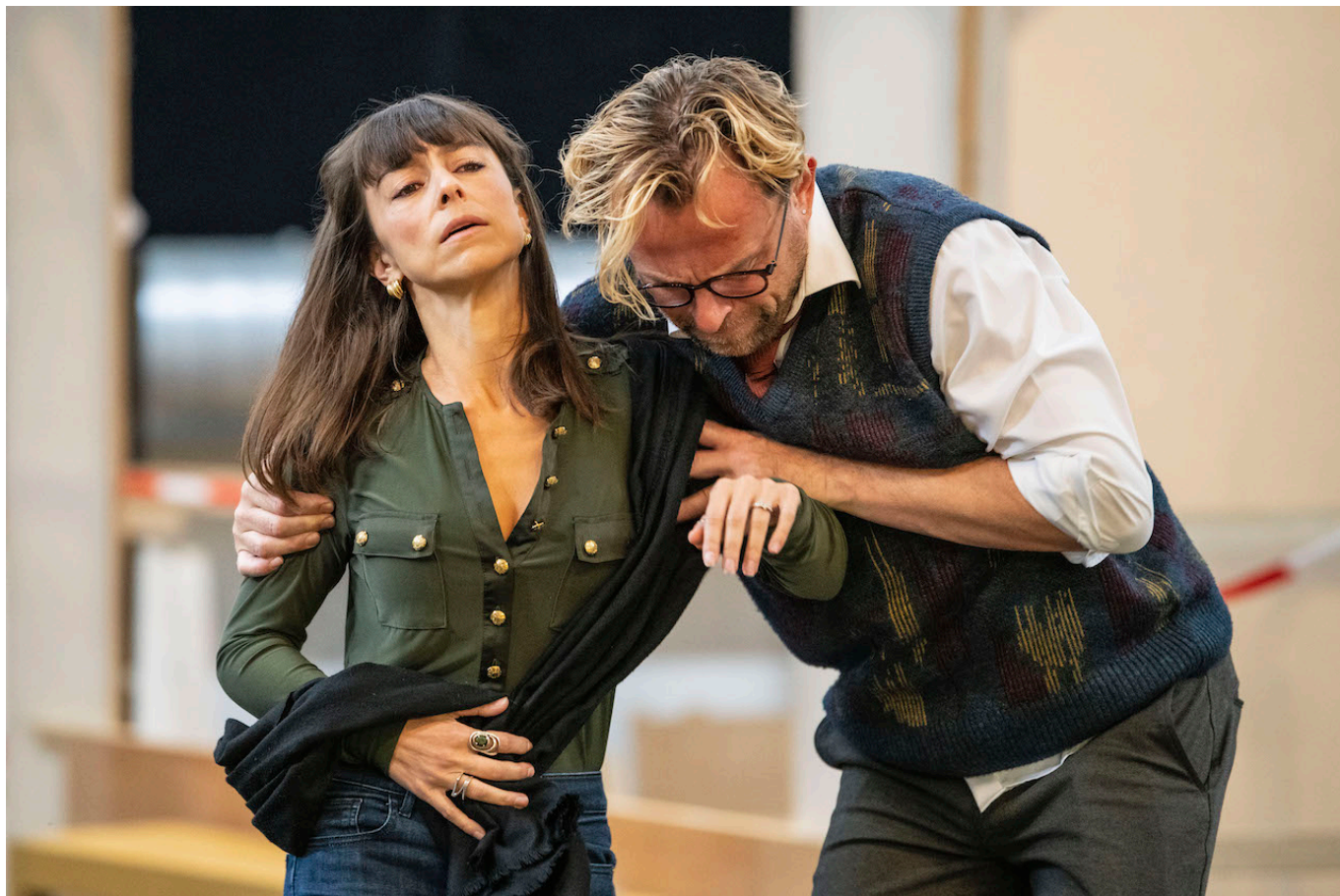
На репетиции спектакля "Катя Кабанова" в Большом театре Женевы

Большинство оперных экспертов, рассуждая о «Кате Кабановой» Яначека, обращают внимание на введение им в партитуру редкого инструмента виоль д'амур (фр. violle d'amour – виола любви), широко использовавшегося в эпоху барокко и раннего классицизма, а затем уступившего места альту и виолончели: тембр у него нежнее, чем у альты, чуткое ухо сразу это услышит. Еще одна отличительная особенность – в оперное действие впервые введен пейзаж: как и в тексте Островского, в музыке Яначека отведена особая роль Волге. Наконец, все согласны в том, что музыка оперы не содержит элементов русского фольклора (что часто выглядит, как китч), что ничуть не умаляет драматизма сюжета. С той поправкой, что представители «темного царства» отошли на второй план, а все происходящее воспринимается через внутреннюю борьбу Катерины, которая, по словам знаменитого советского музыковеда Б. Асафьева, «у Яначека утратила купеческую архаичность и стала современной женщиной, интеллигентски чувствующей и страдающей».