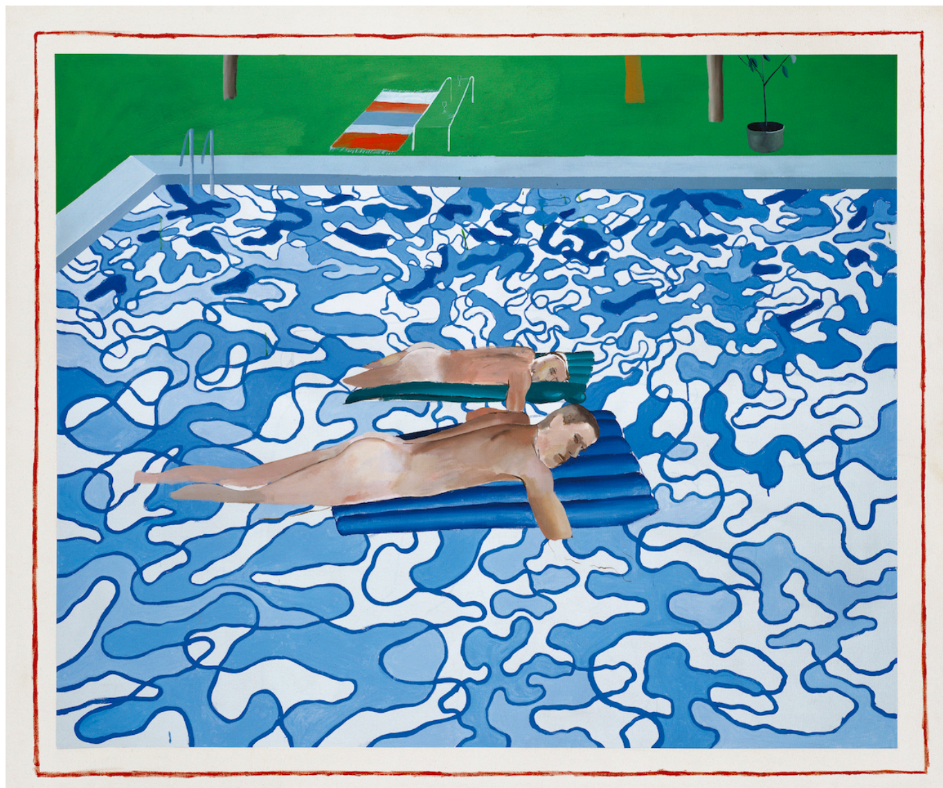
Дэвид Хокни. Калифорния (копия с картины 1965 года), 1987 год. Los Angeles County Museum of Art © David Hockney

Настоящая слава пришла к Хокни в Лос-Анджелесе в 1960-х годах, когда он создал серию картин с бассейнами. Художника особенно интересовало то, как запечатлеть на полотне воду – нужного ему эффекта он добился с помощью «танцующих» линий, передающих игру света на поверхности воды. Солнечный мегаполис на берегу Тихого океана очаровал его. Ему нравились широкие бульвары, геометрические здания, высокие пальмы у обочин дороги, поливальные машины в садах, словом, жизнь в современном большом городе. В Лос-Анджелесе, в отличие от Лондона, художник также смог больше не скрывать свою гомосексуальность: мужская обнаженная натура стала одним из центральным мотивов в его картинах.