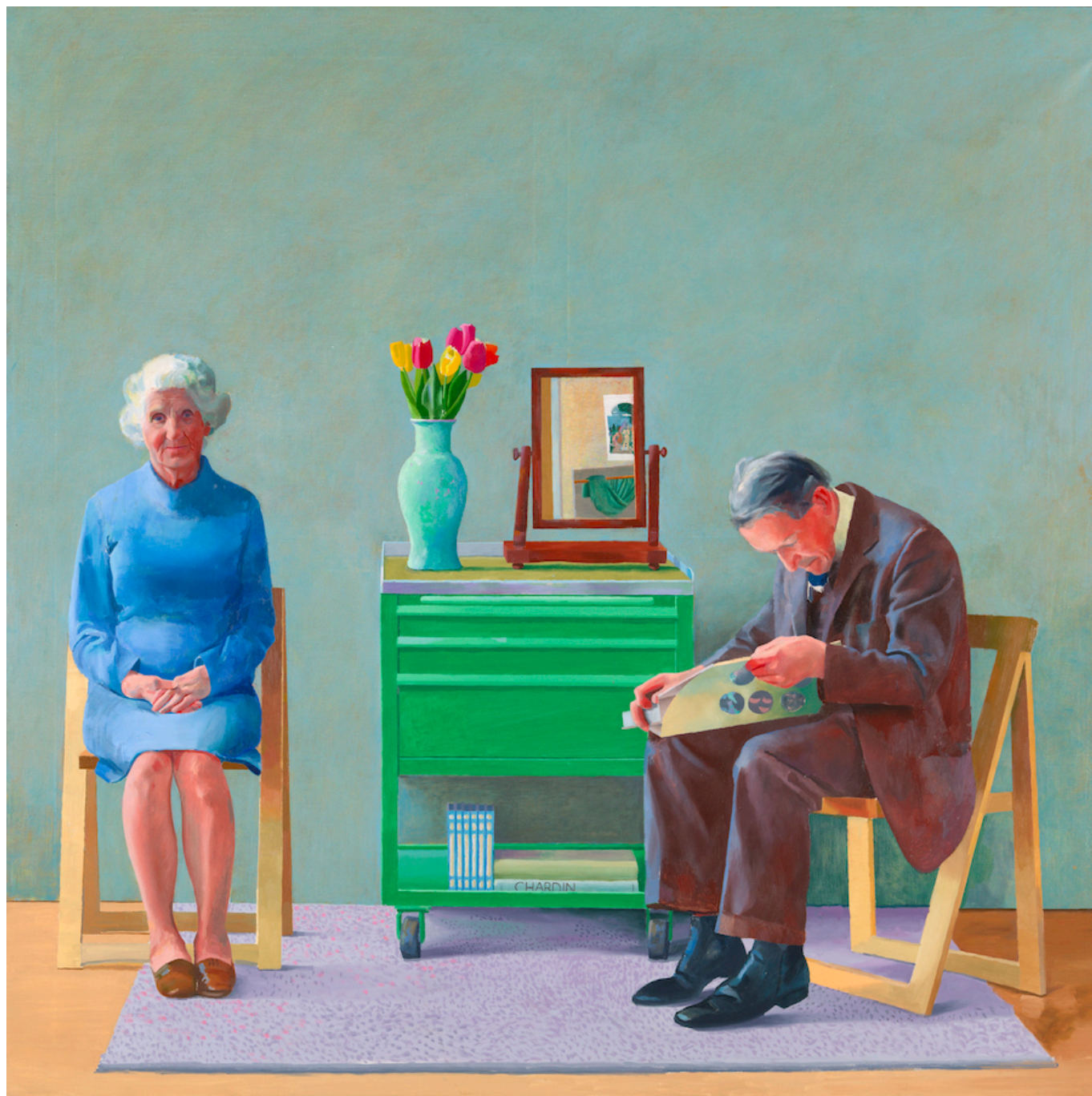
Дэвид Хокни. Мои родители, 1977 г. Тейт: приобретено в 1981 году

В одном из последних залов выставлена монументальная работа «Большие деревья у воды». В течение нескольких недель художник ездил между студией и лесом, работая одновременно над несколькими фрагментами полотна. Чтобы сохранить общую композицию, Дэвид Хокни компоновал изображения на компьютере. В результате получилась гигантская картина, состоящая из 50 видов весеннего Йоркшира и имеющая в длину 12 метров. Другую стену занимает еще один монументальный пейзаж с тропинкой, вьющейся между деревьев с разноцветными листьями, ветвями и стволами. Обязательно присядьте отдохнуть на скамейке в центре зала между этими двумя картинами, всмотритесь в пейзаж и попытайтесь мысленно прогуляться по этому сказочному лесу и услышать шелест листьев на ветру.