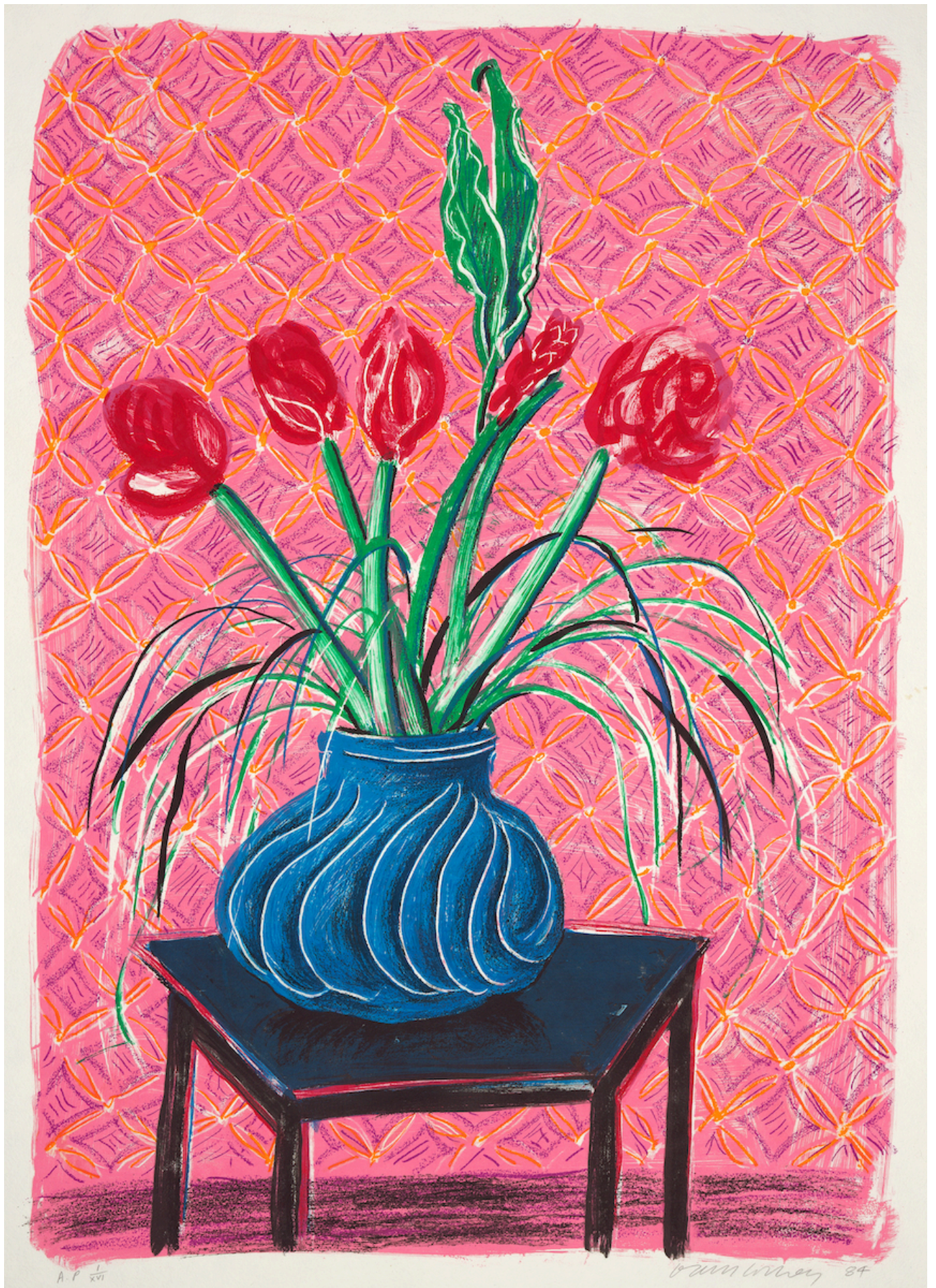
Дэвид Хокни, Амариллис в вазе, 1984. Тейт: дар художника 1993 © David Hockney / Tyler Graphics Ltd.