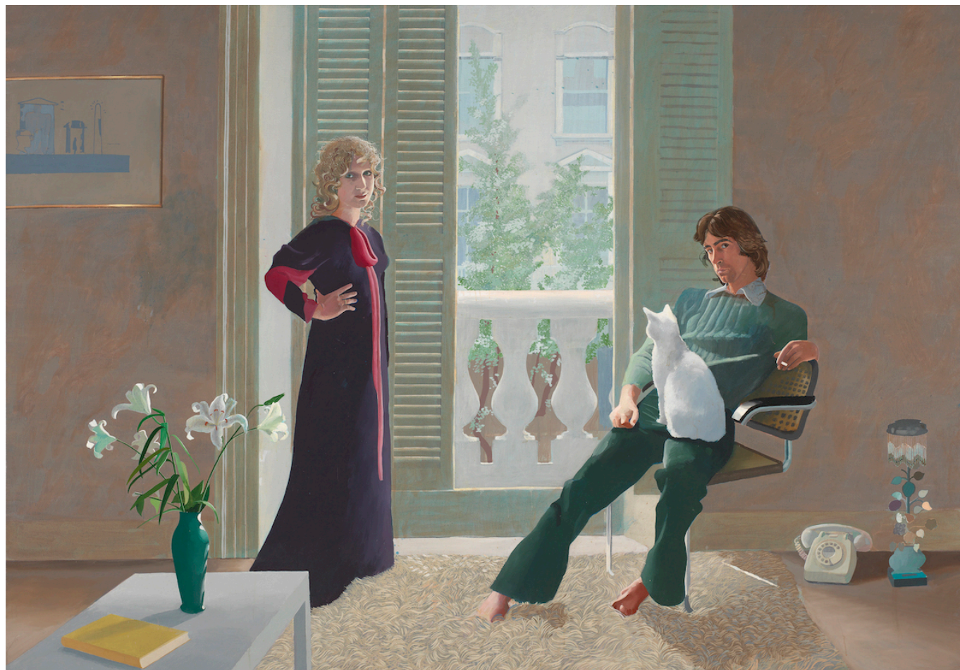
Дэвид Хокни. Мистер и миссис Кларк и Перси, 1970 г. Тейт: Дар друзей галереи Тейт 1971© David Hockney

правильно воспроизвести босые ноги Осси, поэтому спрятал его пальцы в пушистом ковре. Сам ковер, расклешенные брюки, телефон и торшер с бахромой типичны для 1970-х годов. Слева на заднем плане внимательный зритель заметит рисунок из серии Хокни.