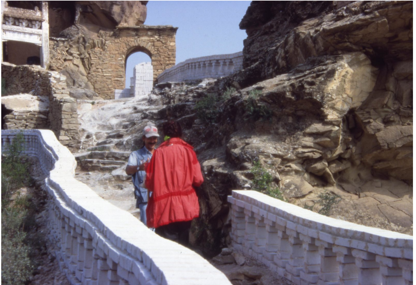
Встреча Марины Абрамович и Злая на Великой Китайской стене, 1988 г.

Два года назад Наша Газета рассказывала о сделанной в 1981 году серии полароидных фотографий в четырех частях Modus Vivendi Марины Абрамович и Улая, которая была выставлена в Художественном музее Берна. Работа, которую теперь увидят посетители Images Vevey, занимает особое место в творчестве обоих художников. Марина и немецкий художник-концептуалист и перформансист Улай познакомились в 1976 году в Амстердаме и быстро поняли, что их объединяет идея «коллективного существа», которое они сами называли как «Другое».