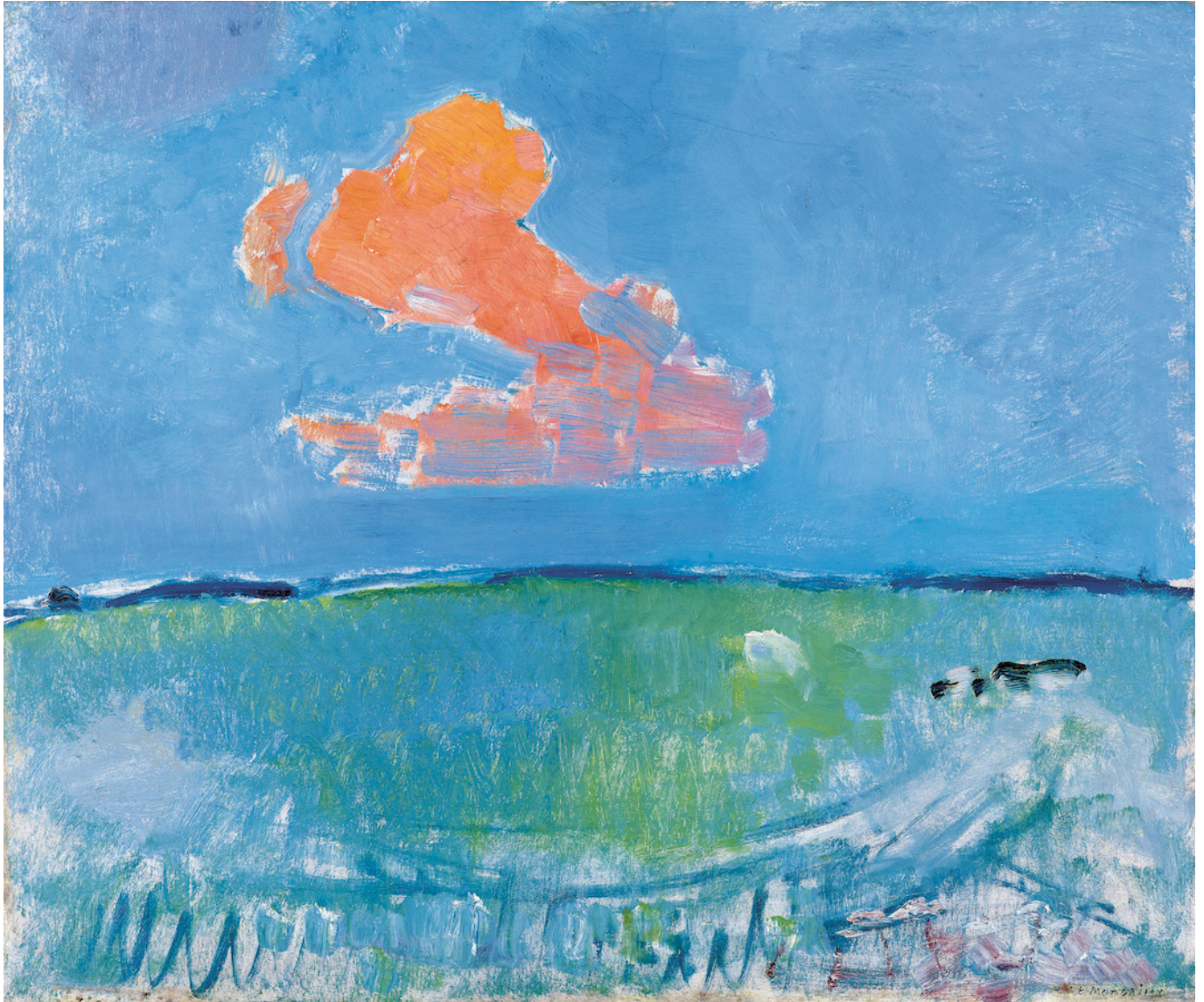
Пит Мондриан. Красное облако, 1907 г. Гаагский музей искусств, Нидерланды © 2022 Mondrian/Holtzman Trust. Фото: Musée d'Art de La Haye

После цветовых экспериментов 1907-1911 годов Мондриан, вдохновленный знакомством с кубистами в Париже, вернулся к менее ярким цветам. В его картинах этого периода преобладают серые и охристые тона, а линии приобретают все большее значение.