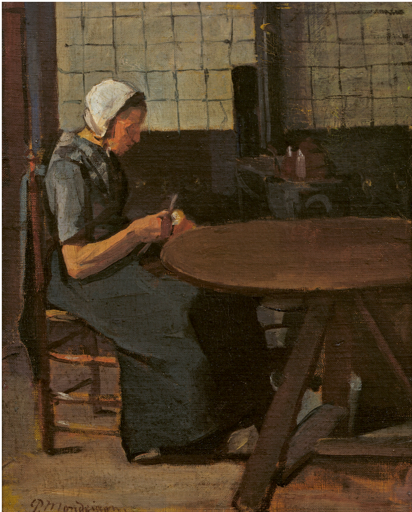
Пит Мондриан. Женщина с веретеном, ок. 1893-1896 гг.

В начале 1910-х годов Мондриан увлекся цветом. На его полотне «Красное облако» 1907 года запечатлен волшебный момент, когда заходящее солнце окрашивает облако в ярко-красный цвет, в то время как небо остается ярко-синим. Эта картина принадлежит к группе работ, которые Мондриан писал в сумерках, когда оттенки быстро меняются. На автопортретах 1908 года он также изображает себя в сумерках