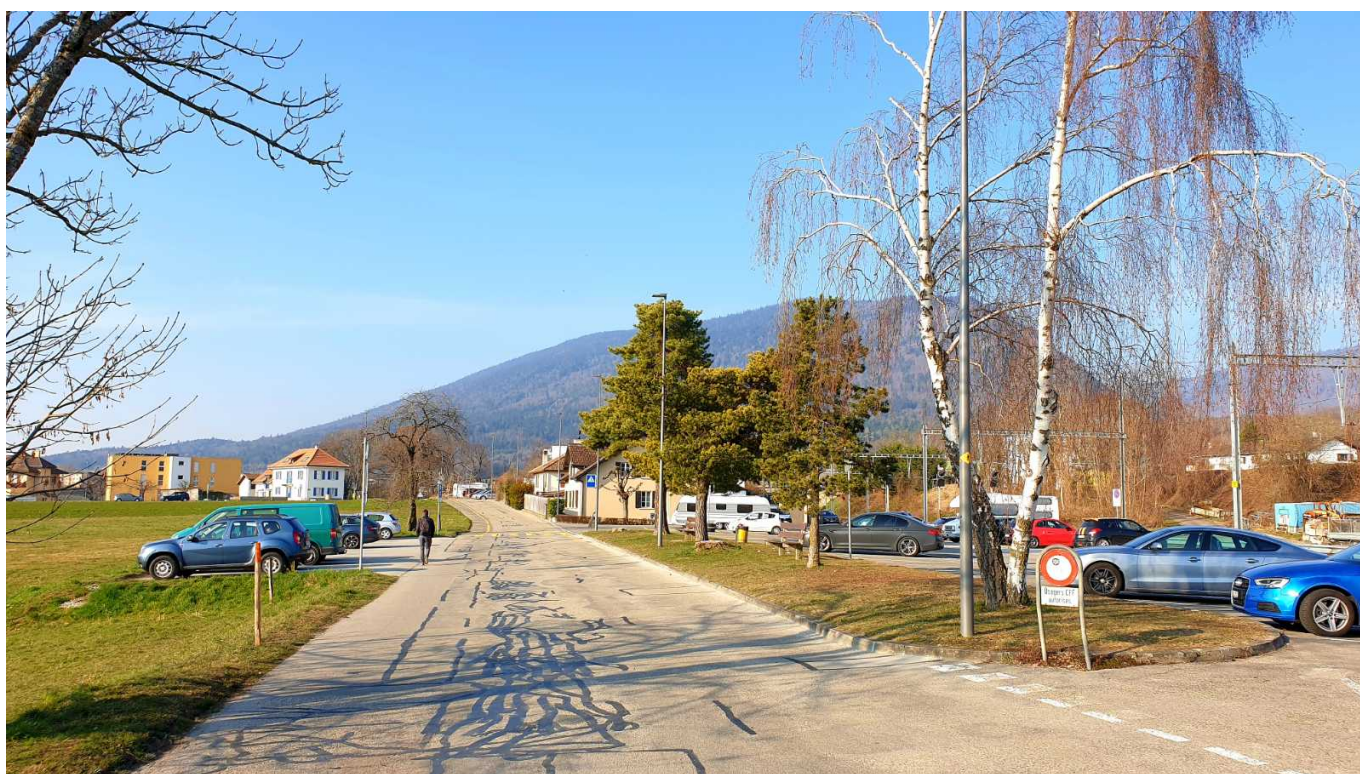
Будри - по дороге к миграционному центру © Е. Григоренко

Автор: Евгений Григоренко, Женева , 02.06.2022.