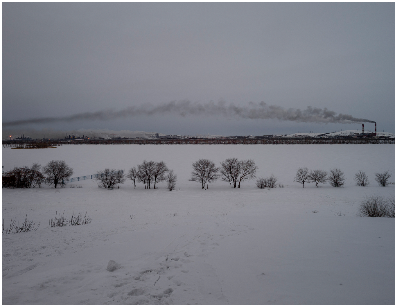
Магнитогорский металлургический комбинат

Морис Шобингер : Признаюсь, мы сомневались, выпускать книгу или нет. Но решили выпускать. Мне кажется неправильным закрывать все окна и двери, надо, наоборот, пытаться как можно более всесторонне объяснять эту страну, чтобы лучше понять происходящее. Это мое личное мнение, не все его разделяют.