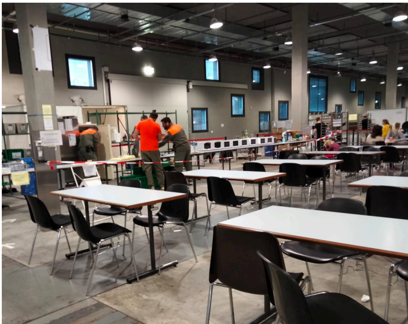
Столовая центра по размещению беженцев в Болье, Лозанна. (с) Ivan Grézine

Автор: Иван Грезин, Берн-Кьяссо-Штанштад-Лозанна , 11.04.2022.