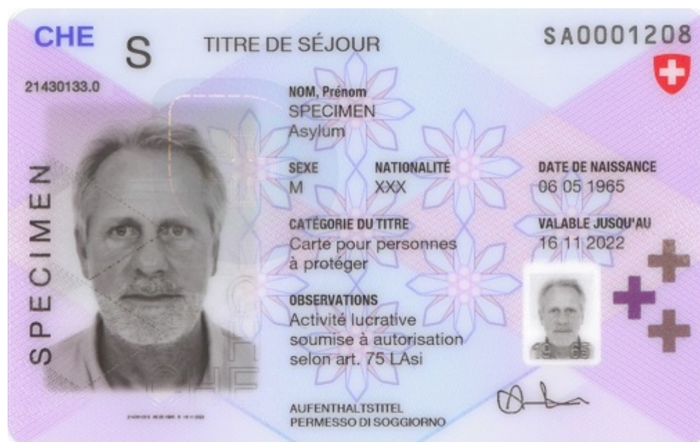
Образец вида на жительство типа S.