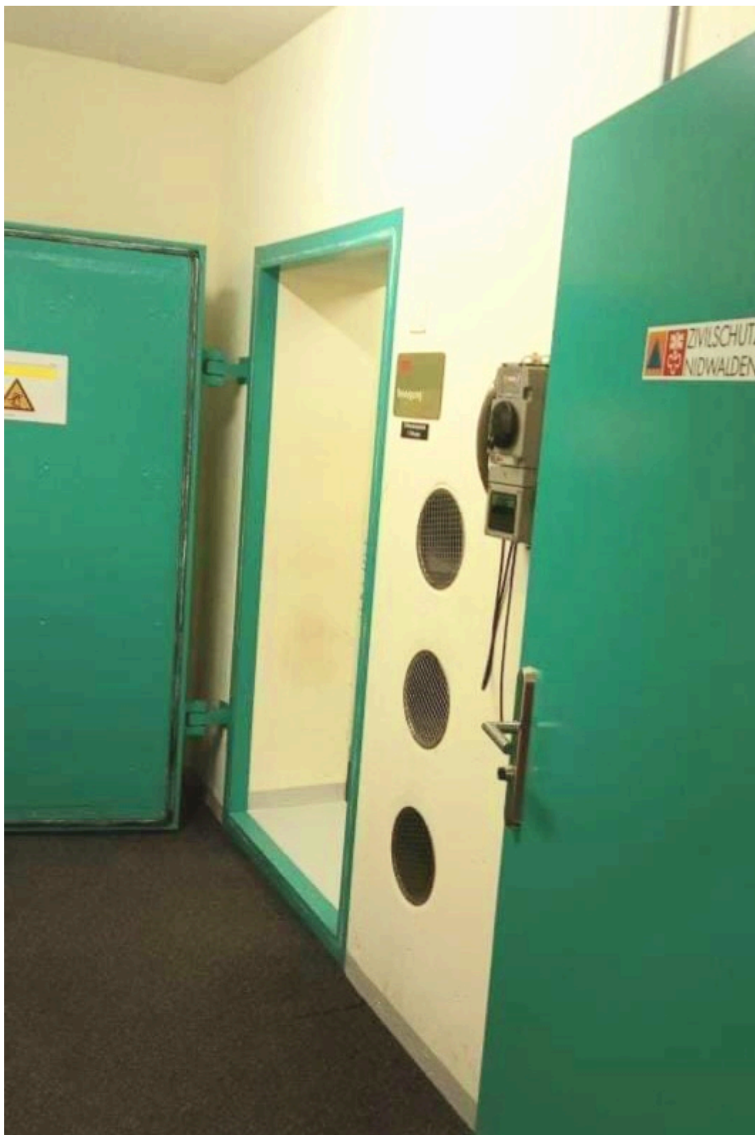
В Нидвальдене беженцы временно размещаются в противоатомном убежище.

Как видно из типового письма, вопросам медицинского страхования и неотложной медицинской помощи, если таковая необходима, уделяется особое внимание. До получения страхового полиса это первое письмо может служить основанием для такой чрезвычайной помощи. Особо оговариваются компенсации принимающим беженцев частным лицам и/или организациям, которые могут помогать оказывать неотложную медицинскую помощь за свой счет.