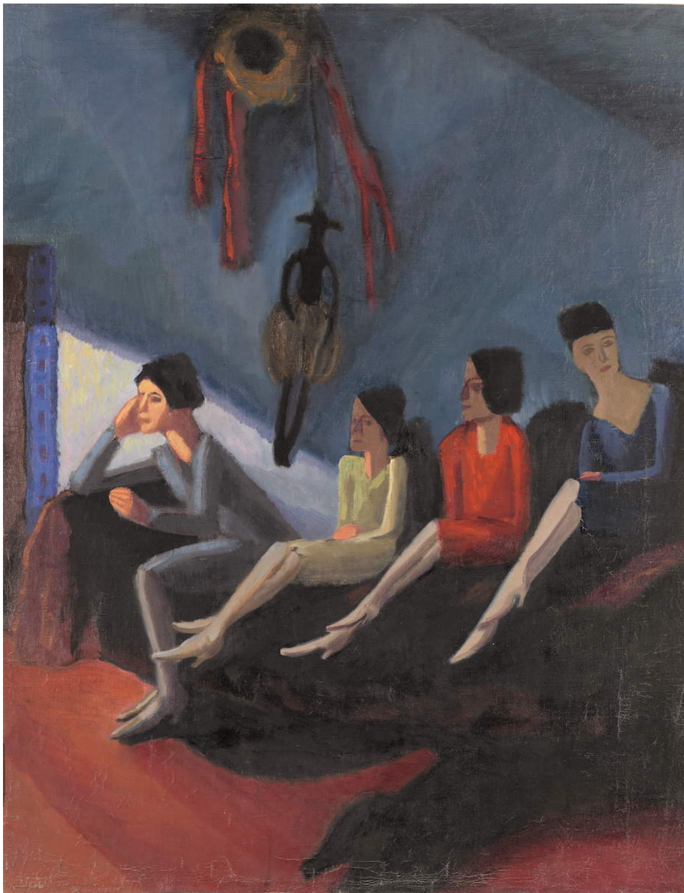
Gabriele Münter Zuhörerinnen [Auditrices], env. 1925 1930 Huile sur toile 69,2 x 54 cm

поздними картинами Мюнтер, на которых изображены женщины нового времени. Ее героини кажутся уверенными в себе, они курят, читают, носят модные короткие стрижки и платья без корсетов – и им, кажется, совершенно все равно, что о них думают мужчины.