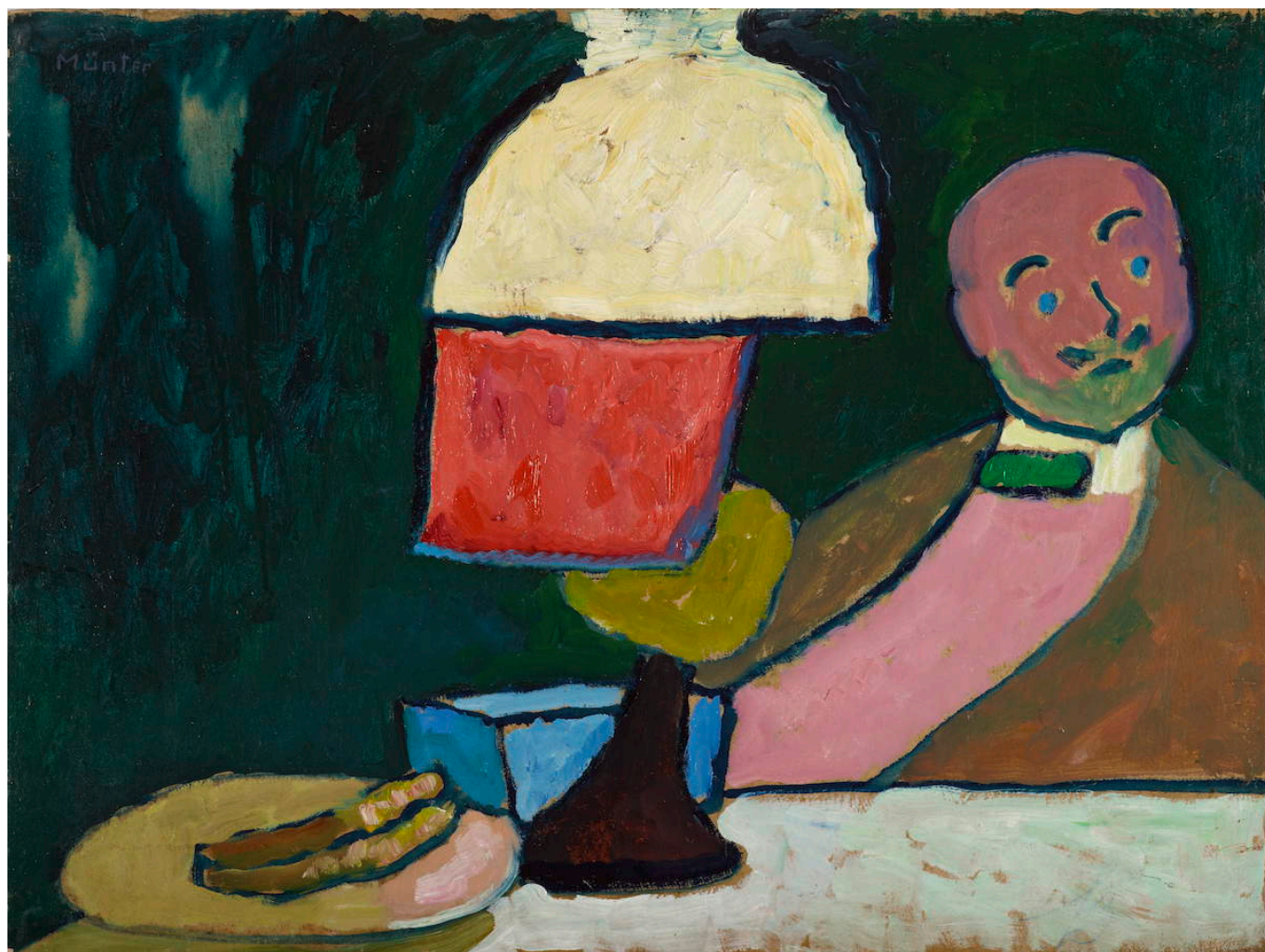
Gabriele Münter Zuhören (Bildnis Jawlensky) [A l'écoute (Portrait de Jawlensky)], 1909 Huile sur carton 49,8 x 66,4 cm Städtische Galerie im Lenbachhaus und Kunstbau München, Gabriele Münter Stiftung 1957