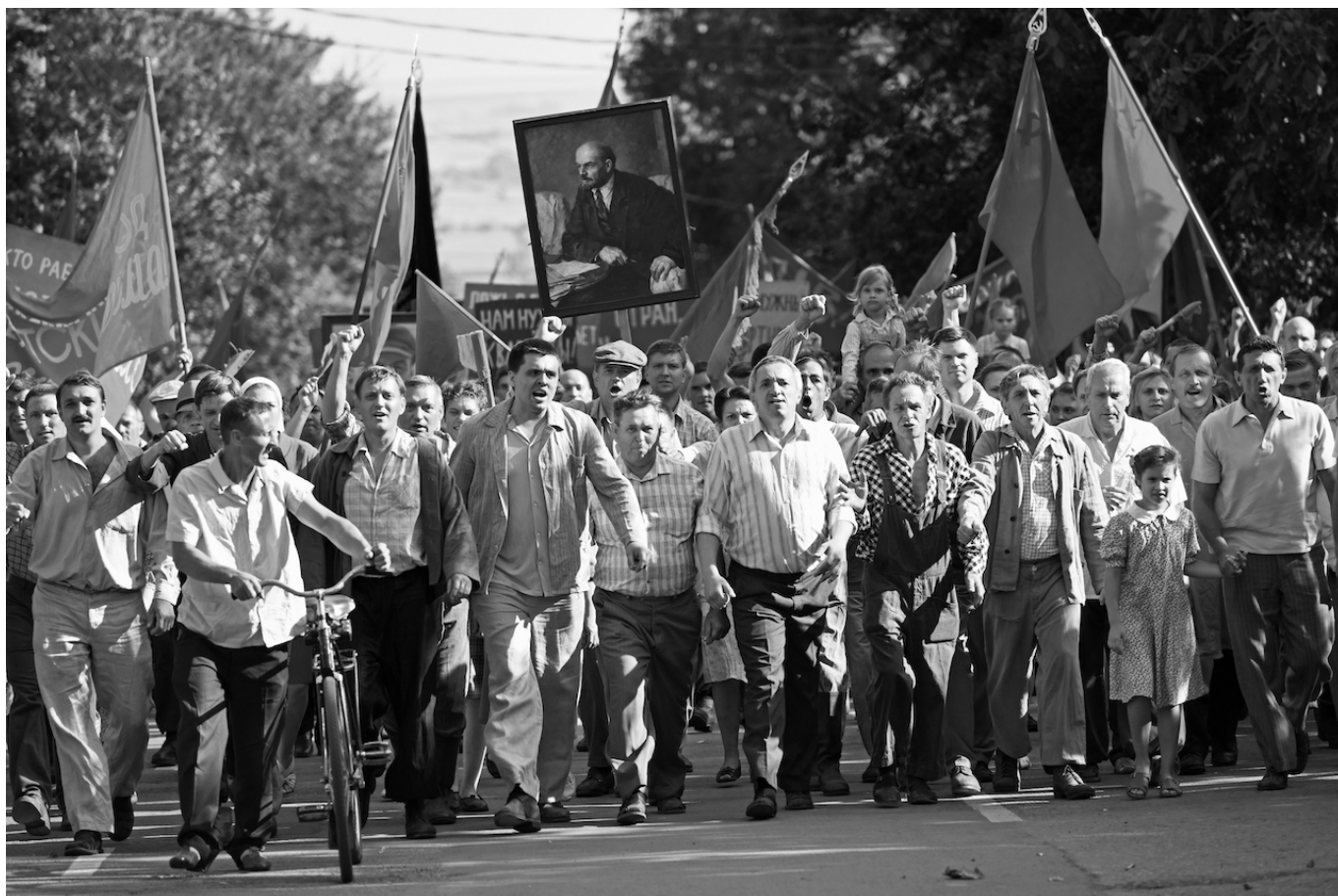
Кадр из фильма Андрея Кончаловского "Дорогие товарищи"

правоохранительных органах и пользующийся уважением коллег и начальства. Неожиданно для всех его объявляют преступником, и в одночасье он превращается в изгоя. Ему удастся бежать, но явившийся с того света вестник предвещает жизнь в течение всего одних суток, а затем – вечные муки в аду. Впрочем, и тут есть лазейка – достаточно раскаяться и заслужить прощение хотя бы одного человека. О том, как Федор добивается этого прощения, и рассказывает постмодернистская притча, получившая приз имени Г. Горина за лучший сценарий на сочинском «Кинотавре» в 2021 году.