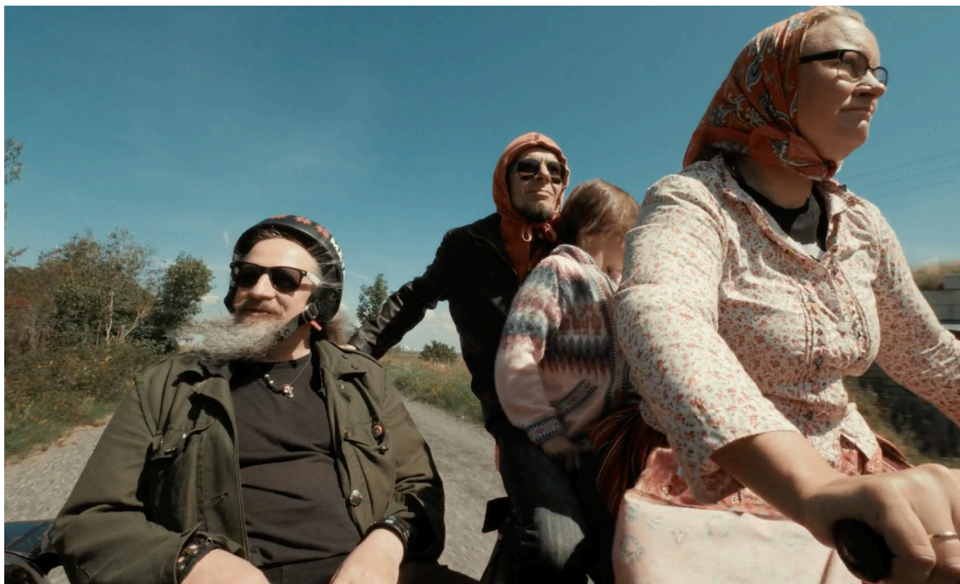
Кадр из фильма Аи Блей "Мы хотели изменить мир"

В музыкальном разделе фестиваля Black Movie участвует картина «Мы хотели изменить мир» - первый полнометражный документальный фильм латвийского режиссера Аи Блей. Он посвящен истории созданной еще в советской Латвии панк-рок-группы Inokentijs Marpls, пережившей смерть давшей ей жизнь страны и продолжающей активную деятельность. Участники группы, теперь уже пятидесятилетние, не стареют душой, но у каждого из них – личная драма, раскрывающаяся на фоне юбилейного тура.