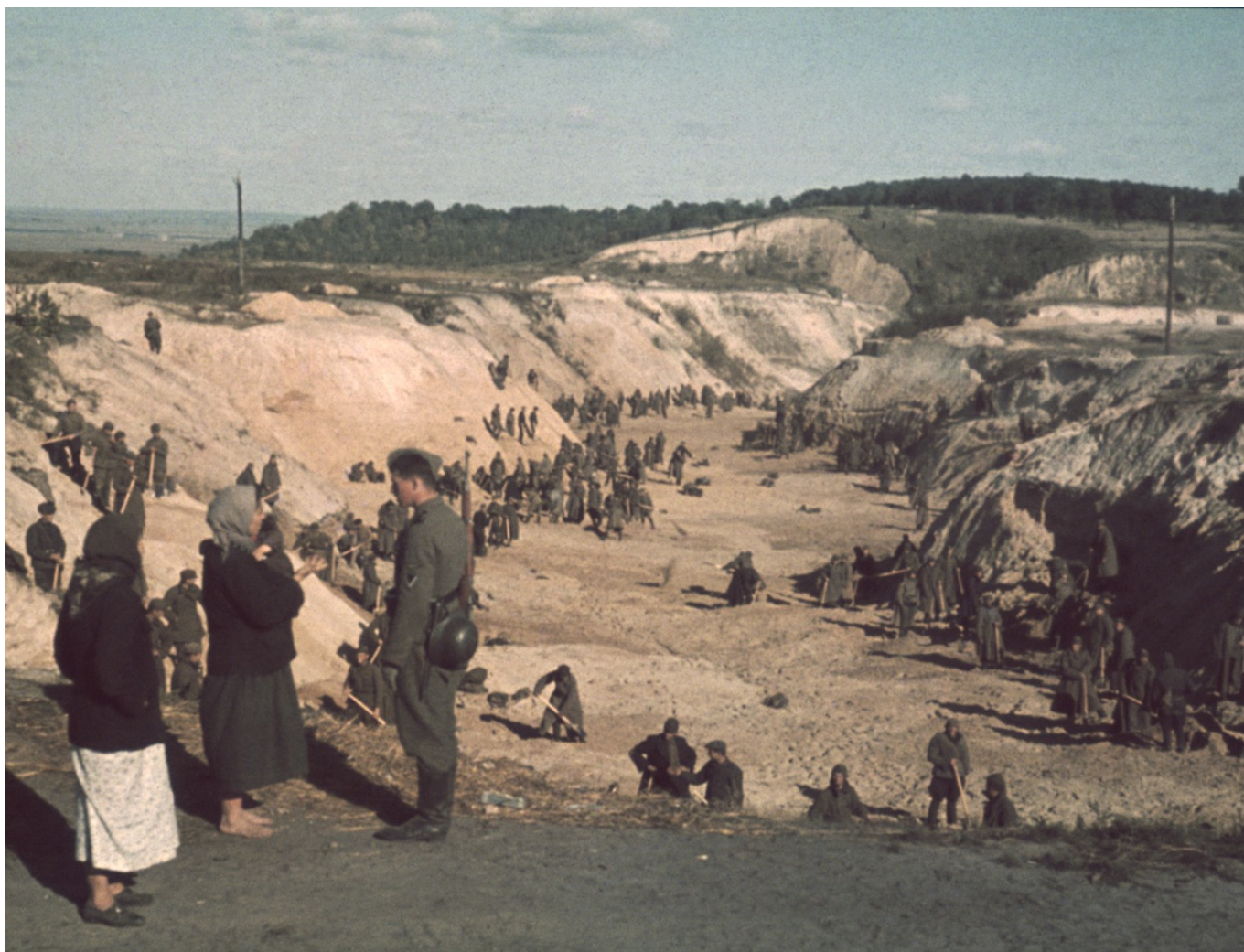
Кадр из фильма Сергея Лозницы "Бабий яр"

Список открывает фильм, снятый в 2021 году украинским режиссером Сергеем Лозницей , с которым мы имели удовольствие познакомиться как раз на фестивале Black Movie в 2019-м. Тема выбрана традиционно непростая. После «Дня Победы» и «Государственных похорон» режиссер продолжает рассказывать правду о нашем прошлом, которое некоторые очень хотят забыть. Фильм «Бабий Яр» смонтирован из документальной хроники, найденной в государственных и частных архивах Германии и Украины, и рассказывает о событиях, предшествующих расстрелу в оккупированном нацистами Киеве 33 771 еврея всего за два дня – 29-30 сентября, и о самой трагедии. В прошлом году на Каннском фестивале, где состоялась премьера картины, она была удостоена приза «Золотой глаз». По словам режиссера, выросшего в Киеве по соседству с Бабьим Яром и регулярно проходившего через парк, разбитый на месте бывшего еврейского кладбища, осознать происшедшее ему помогли книга Анатолия Кузнецова «Бабий Яр» и эссе Василия Гроссмана «Украина без евреев» - на территории бывшего Советского Союза это эссе было опубликовано на русском языке полностью только один раз, в рижском еврейском журнале «Век» в 1991 году. Автор картины о еврейской трагедии и государственном советском антисемитизме, обошедшийся без комментариев, рассчитывал на сильные переживания зрителей. Не сомневаемся, что они будут!