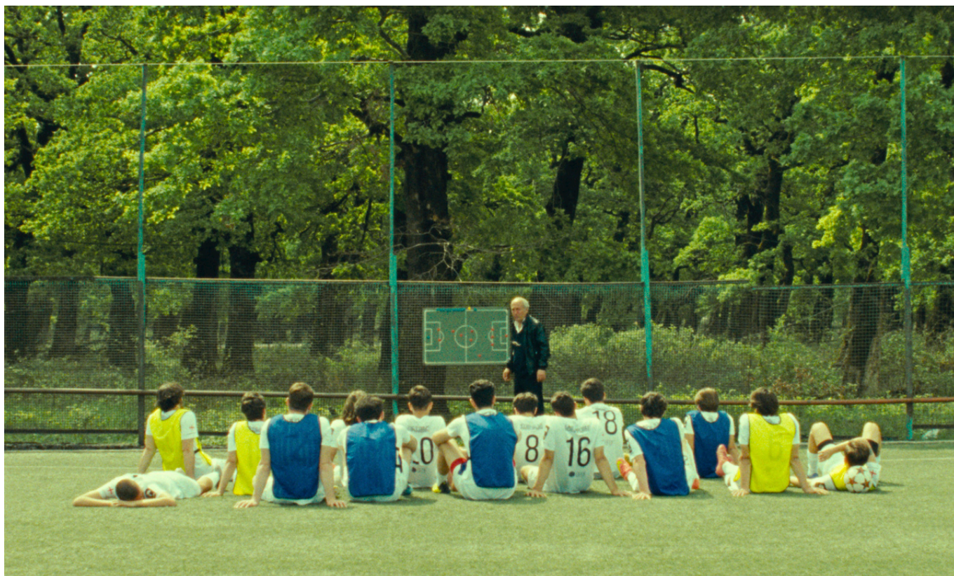
Кадр из фильма Александра Коберидзе "Что мы видим, когда смотрим в небо"

Из Северной Осетии мы перенесемся в недалекую от нее Грузию благодаря режиссеру Александру Коберидзе. Его фильм «Что мы видим, когда смотрим в небо?» получил на Берлинском фестивале 2021 года престижную премию ФИПРЕССИ Международной ассоциации кинокритиков, а журнал Filmmaker Magazine назвал картину «большим открытием фестиваля». Зрителю, помнящему золотой век грузинского кинематографа, эта картина многое напомнит, а неوفиту в этой области не напомнит ничего, но заставит сразу и навсегда влюбиться в Грузию с ее юмором, поэзией и ни на какую другую не похожей культурой.