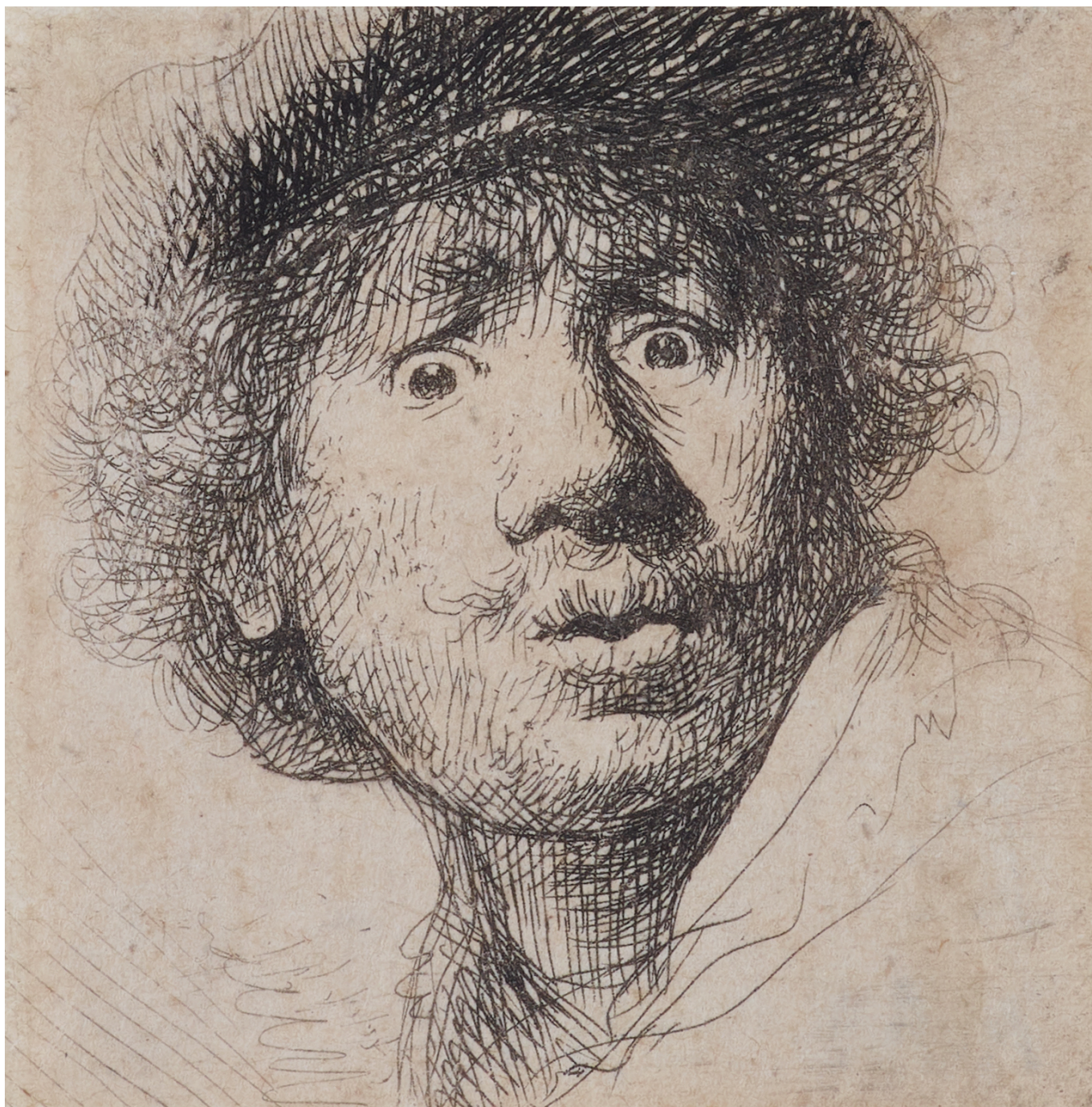
Рембрандт (1606 - 1669), "Голова мужчины в берете", или Рембрандт с дикими глазами, 1630 г. Musée Jenisch Vevey - Cabinet cantonal des estampes, Collection du Musée Alexis Forel