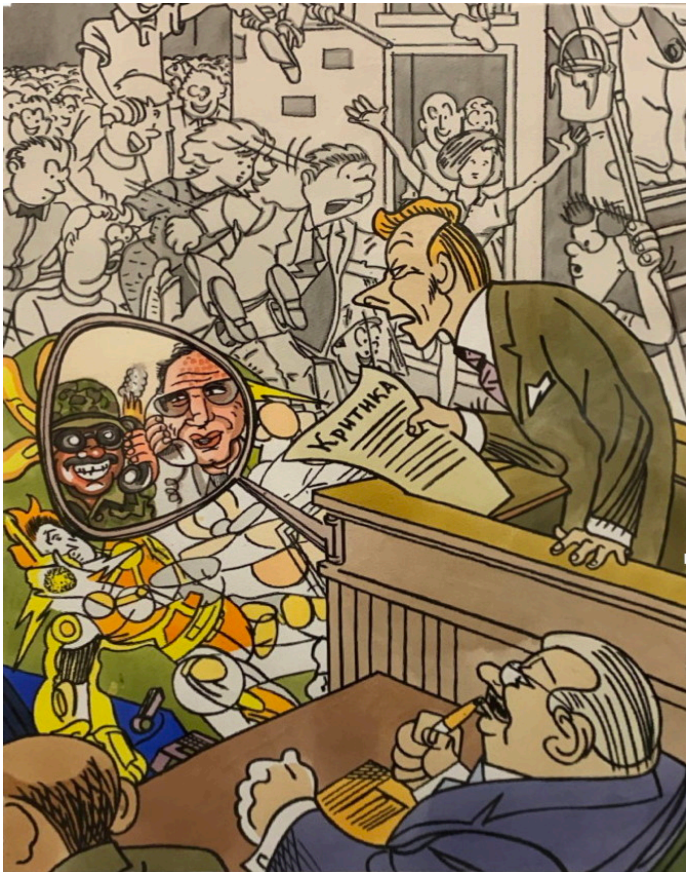
Эрро. Контакт с мафией, 1987 г.