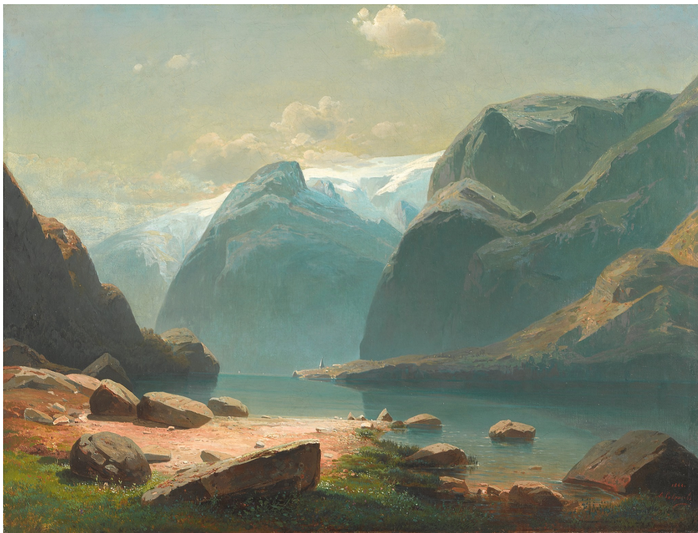
А. Саврасов. Озеро в горах Швейцарии, 1866 г.

Возвратившись в Россию, Каменев пошёл по пути своего учителя и создал замечательные картины, на которых запечатлел очаровательные уголки родной страны. Однако с начала 1870-х годов его картины всё реже появлялись на выставках. Причиной тому стали смерть детей, уход жены и попытки «утопить горе в вине». Как писали в те времена, художник стал «жертвой пагубного пристрастия».