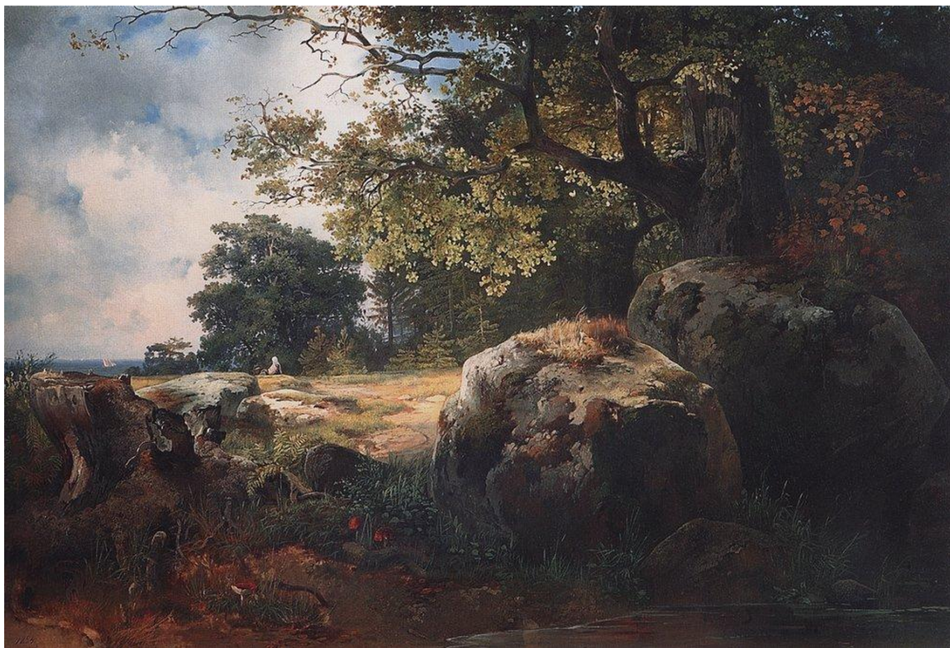
А. Саврасов. "Вид в окрестностях Ораниенбаума", 1854 г.

Автор: Наталья Беглова, Женева , 09.07.2021.