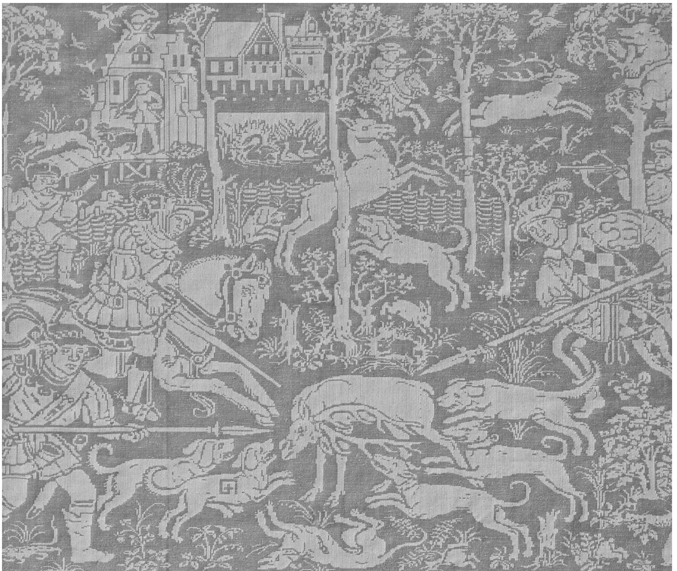
Салфетка с цветочным мотивом и сценой охоты – один из старейших сохранившихся льняных дамастов. Южная Голландия, Кортрейк (?), 1520-1530, Фонд Абегг, инв. №

Выбранная тема кажется на редкость актуальной. Согласно статистике , во время пандемии резко выросли продажи товаров для дома, и в этом нет ничего удивительного. Никогда раньше мы, наверное, не проводили столько времени в четырех стенах, как во время сменяющих друг друга карантин и локдаунов, поэтому стремление сделать свой дом более уютным и комфортным совершенно понятно. Декораторы знают, что самый простой способ освежить обстановку – это сменить текстиль, например, купить новые скатерти. Когда же возник обычай накрывать стол белой тканью? Какими скатертями пользовались раньше? И как сервировали стол аристократичные и зажиточные семьи прошлых столетий? Фонд Абегг предлагает «заглянуть на обед» к состоятельным голландским семьям эпохи Золотого века и узнать ответы на эти вопросы.