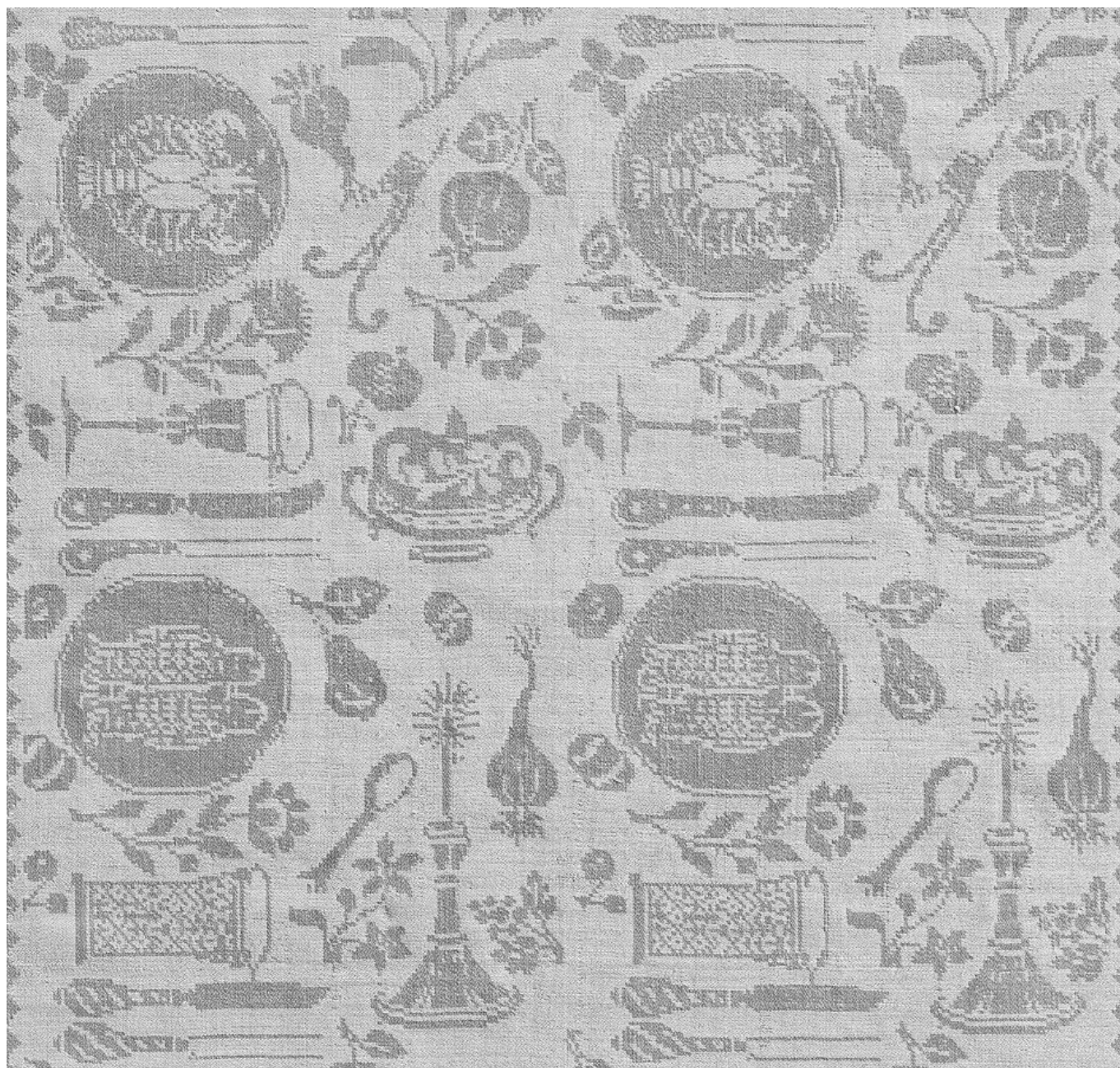
Салфетка с узором в виде сервированного стола. Саксония, около 1690 года, Фонд Абегг, инв. № 3196.

безупречных моральных качеств его обитателей.