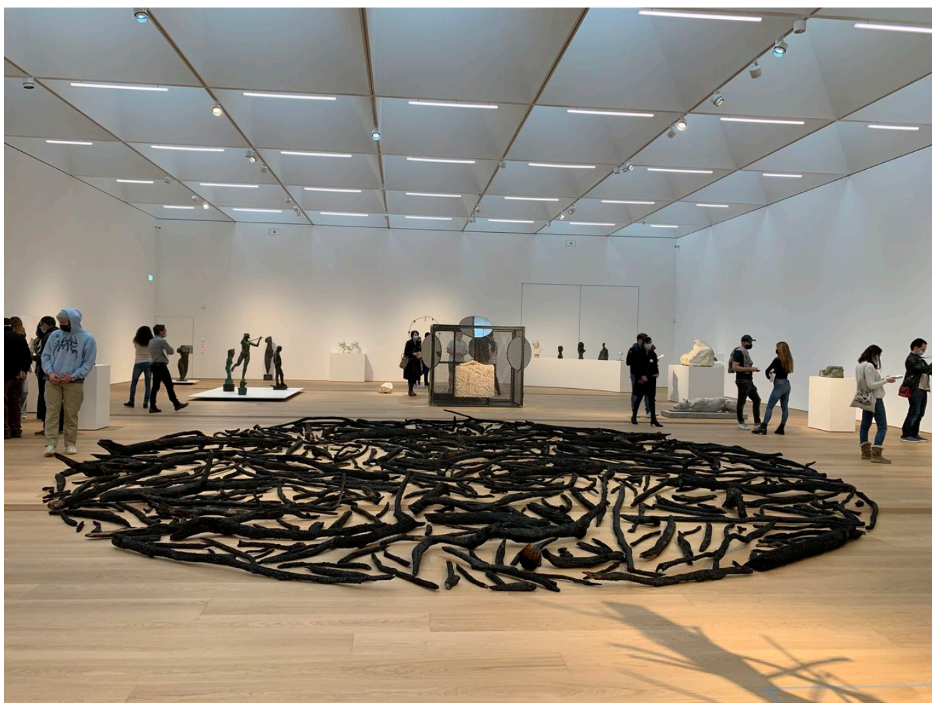
Ричард Лонг, Wood Fire Circle.

Автор: Надежда Сикорская, Лозанна , 19.03.2021.