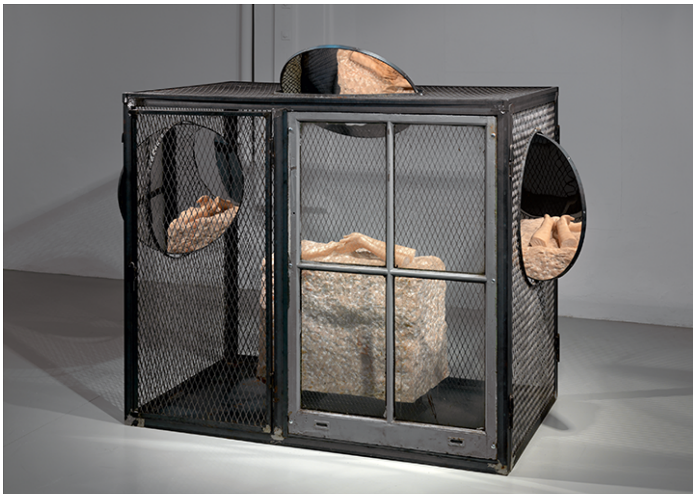
Луиза Буржуа, Cell IX, 1999 г. D.Daskalopoulos Collection © The Easton Foundation / 2021, ProLitteris, Zurich

Еще много чего любопытного можно увидеть на выставке, главный недостаток которой, на наш взгляд, – отсутствие в привычных местах пояснительных табличек, которые сделали бы визит более приятным и поучительным.