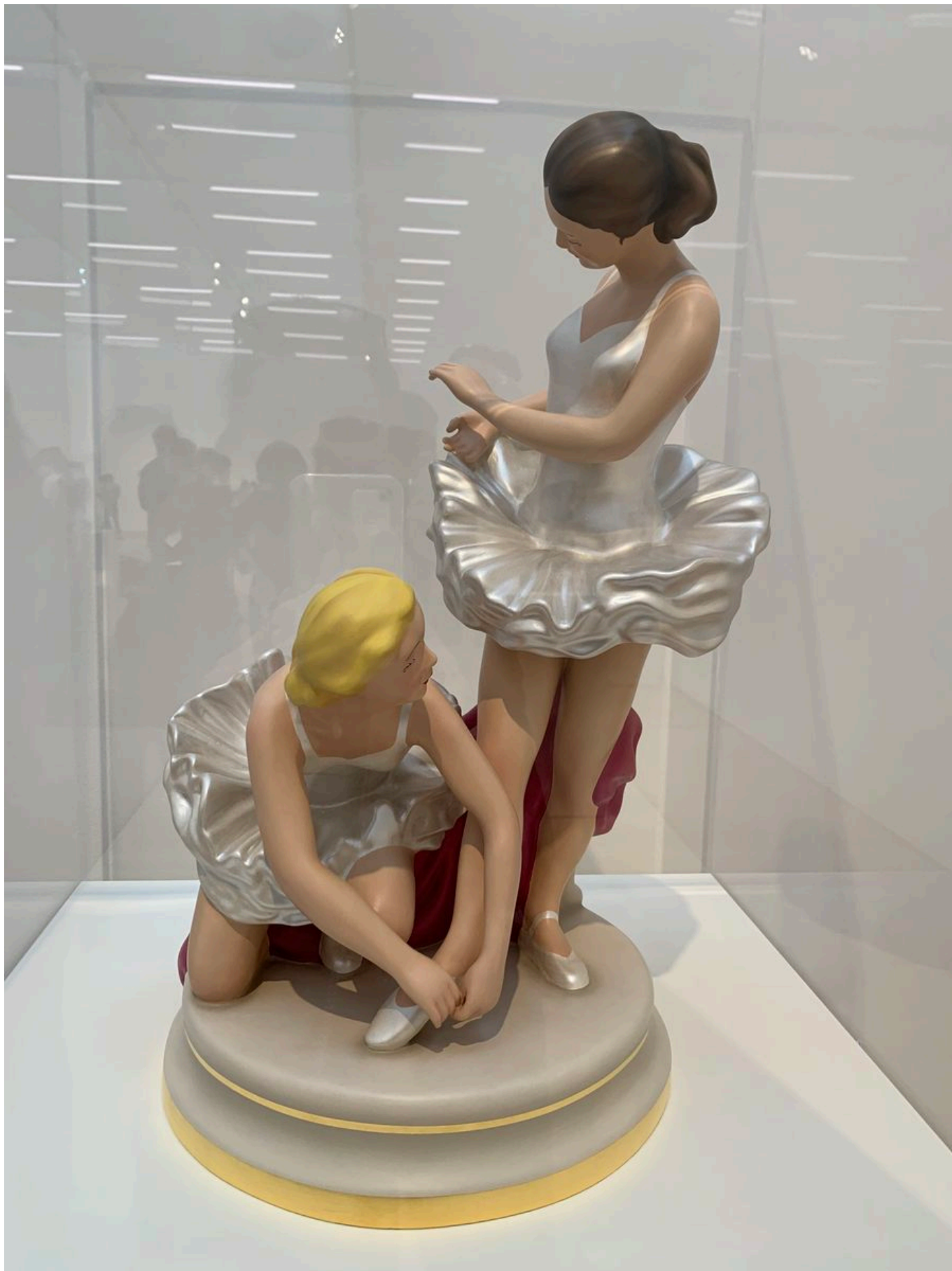
Джефф Кунс. "Балерины", 2017 г. Частная коллекция.

В первом, «Уловить движения», представлены творения Эдгара Дега: одна из его знаменитых «Танцовщиц», вдохновленная балеринами Парижской оперы, «перекликается» с «Балеринами» Джеффа Кунса, навеянными фарфоровыми