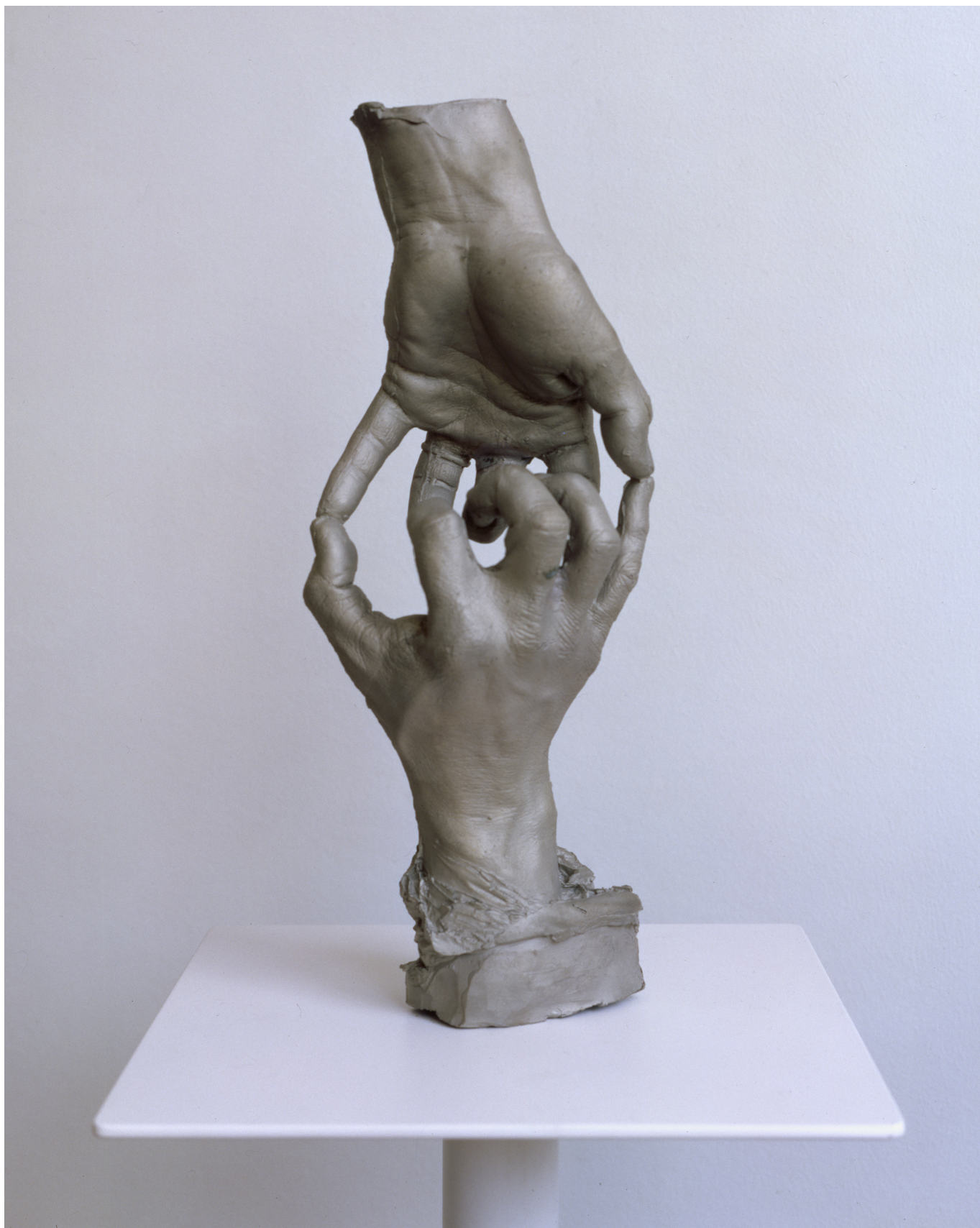
Брюс Науман, "Без названия" (Пара рук), No. H, 1996 Bronze blanc, sur socle conçu par

фигурками – в «горках» наших бабушек хранились такие. «Человек со змеей» Родена, одна из многих скульптурных иллюстраций к «Божественной комедии» Данте, соседствует с работами американца Брюса Наумана, с 1960-х годов использующего в качестве сырья собственное тело. В данном случае, в работе «Hand Pair» (1996), в дело пошли руки.