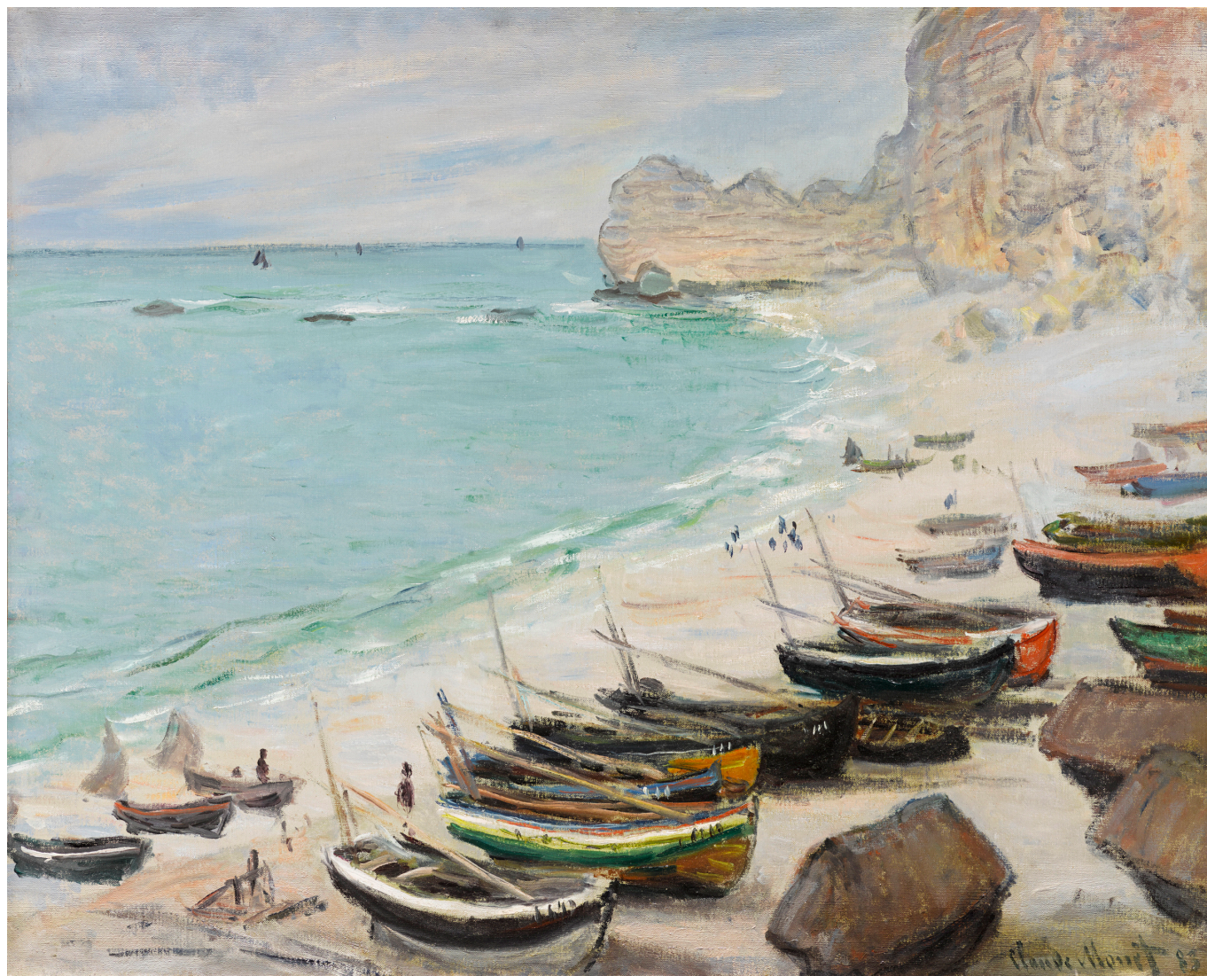
Клод Моне. Лодки на пляже в Этрета, 1883 г.

Чувствительный ко всем формам творчества, Бемберг также увлекался музыкой и литературой. Хороший пианист, он подумывал о карьере композитора, но в итоге предпочел словесность, закончив Гарвард с дипломом специалиста по сравнительной литературе и опубликовав несколько театральных пьес и романов, благосклонно встреченных критикой.