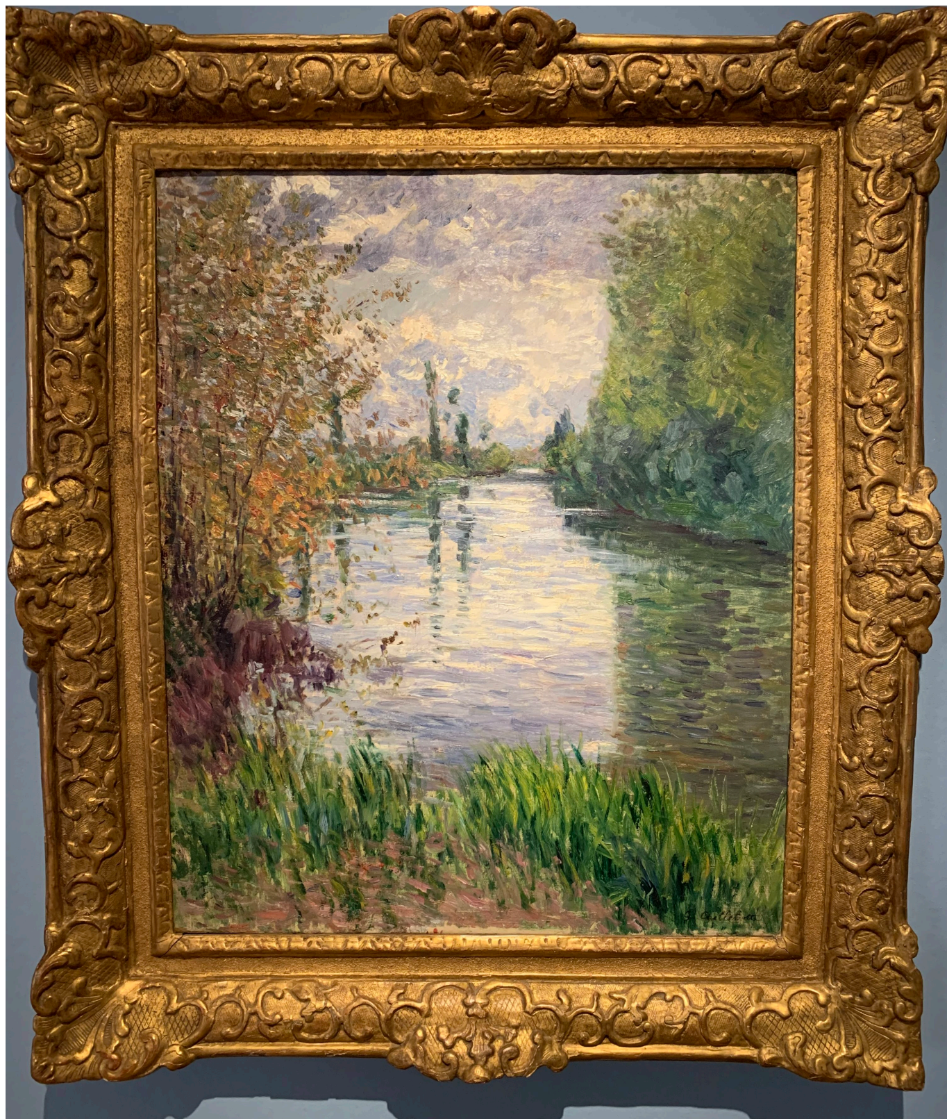
Густав Кайботт (1848-1894). Приток Сены осенью, ок. 1890 г. (Toulouse Fondation Bemberg)