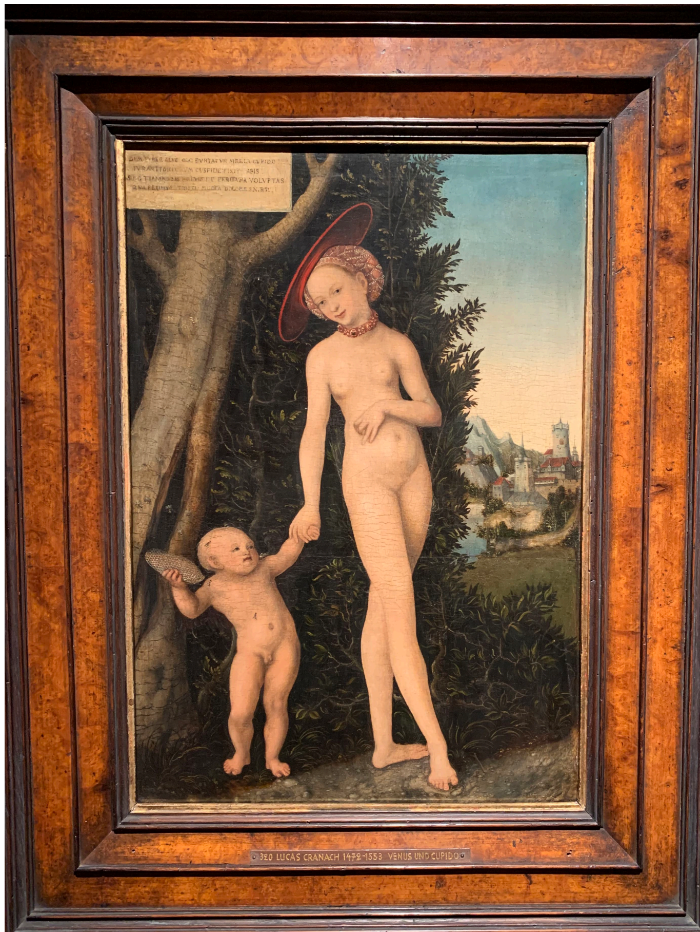
Лукас Кранех Старший. Верена и Амур, ворующий мёд, 1531 г. ((Toulouse, Fondation Bemberg)

Венера и Амур были частыми «гостями» его полотен, одно из которых, созданное в 1509 году, хранится в Государственном Эрмитаже в Санкт-Петербурге. Работа,