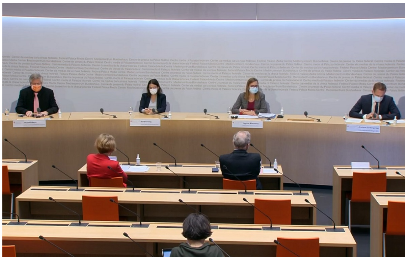
Скриншот трансляции брифинга от 19 января

Автор: Заррина Салимова, Берн , 20.01.2021.