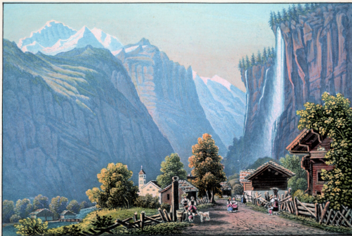
Vue du Staubbach, à Lauterbrunnen.

кажется он неподвижным столбом млечной пены. Скорыми шагами приблизился (авторская орфография сохранена – Н.Б.) я к этому феномену и рассматривал его со всех сторон. Вода прямо летит вниз, почти не дотрогиваясь (авторская орфография сохранена – Н.Б.) до утеса горы, и, разбиваясь, так сказать, в воздушном пространстве, падает на землю в виде пыли или тончайшего серебряного дождя».