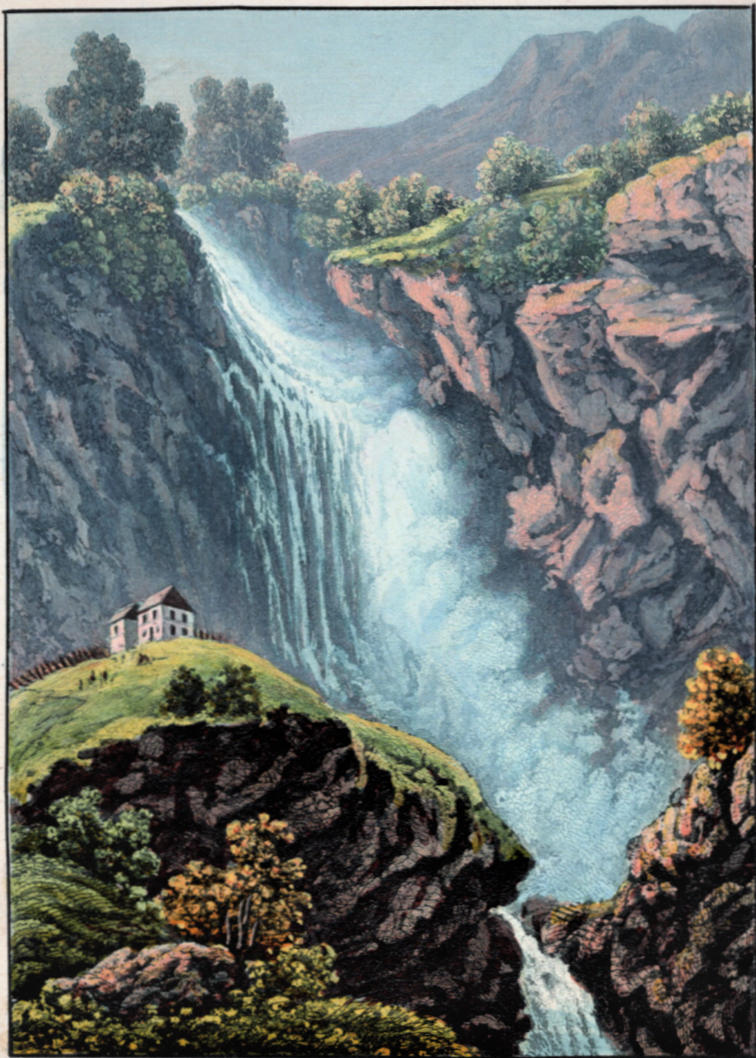
Reichenbach Chûte supérieure. Zürich chez R. Dikenmann Peintre. Rindermarkt, 353.

Рейхенбахский водопад, где произошла смертельная схватка между Шерлоком Холмсом и доктором Мориарти. Гравюра XIX века, раскрашенная акварелью, из альбома «Воспоминания о Швейцарии»