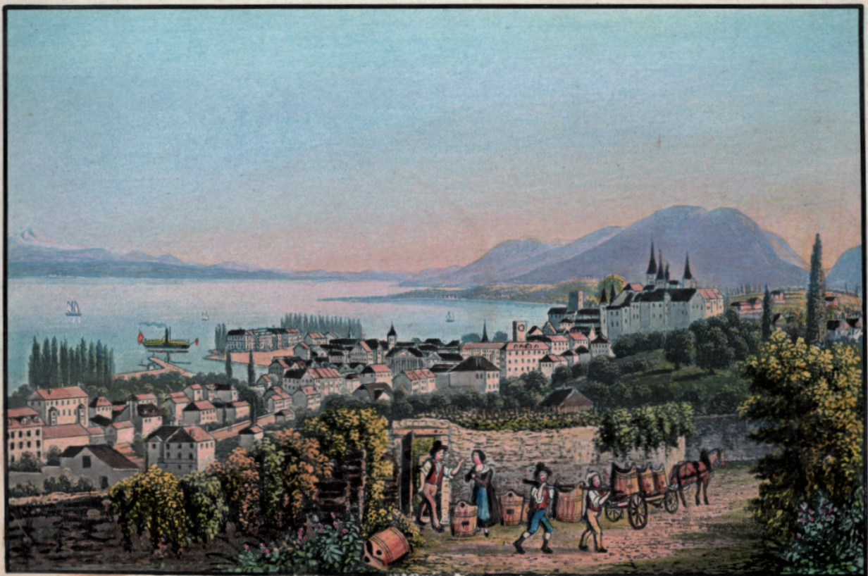
Vue de Neuchâtel

Gravure de H. Pictet avec l'aquarelle de J. Rindermacher. 353.