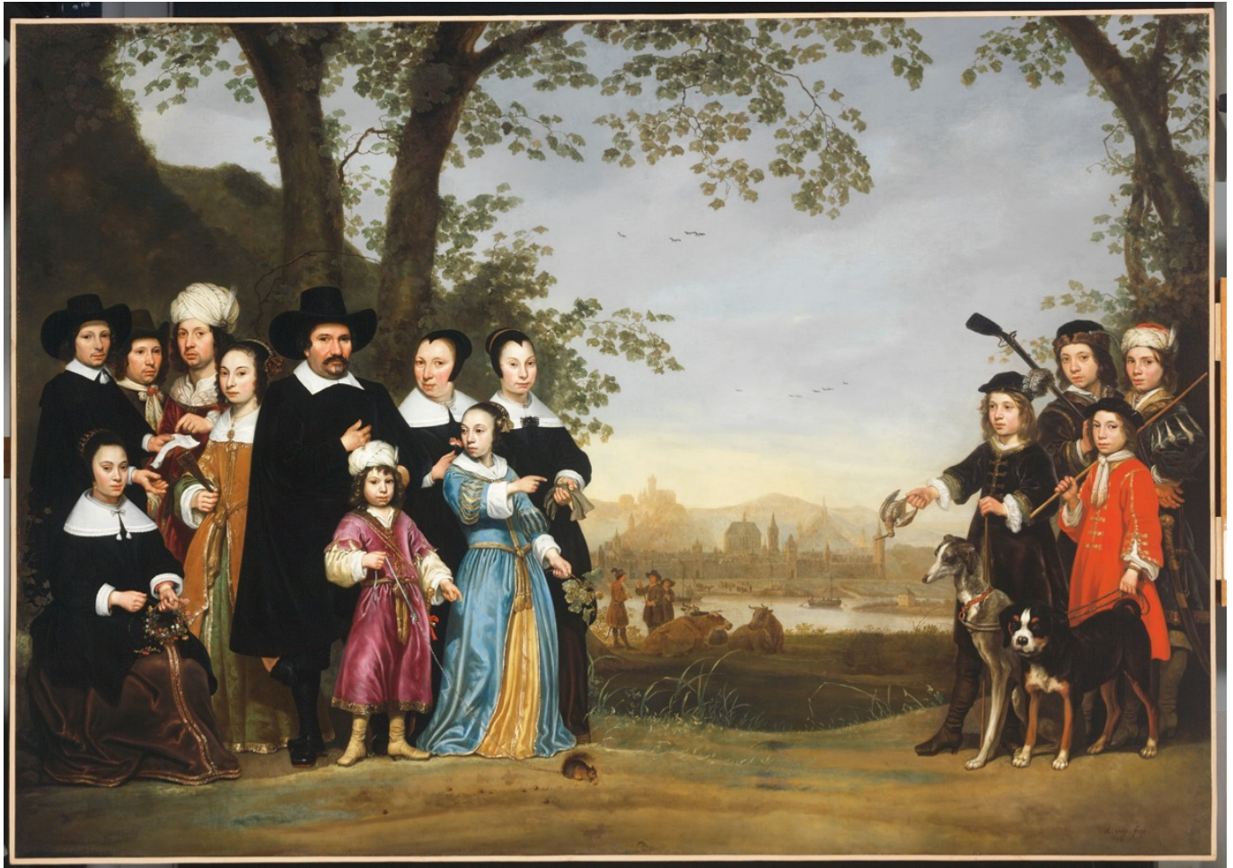
«Gruppenbildnis der Familie Sam», Aelbert Cuyp, um 1653 (с) Szépművészeti Múzeum, Budapest

Россией, странами Балтики, Средиземноморья и Ближнего Востока.