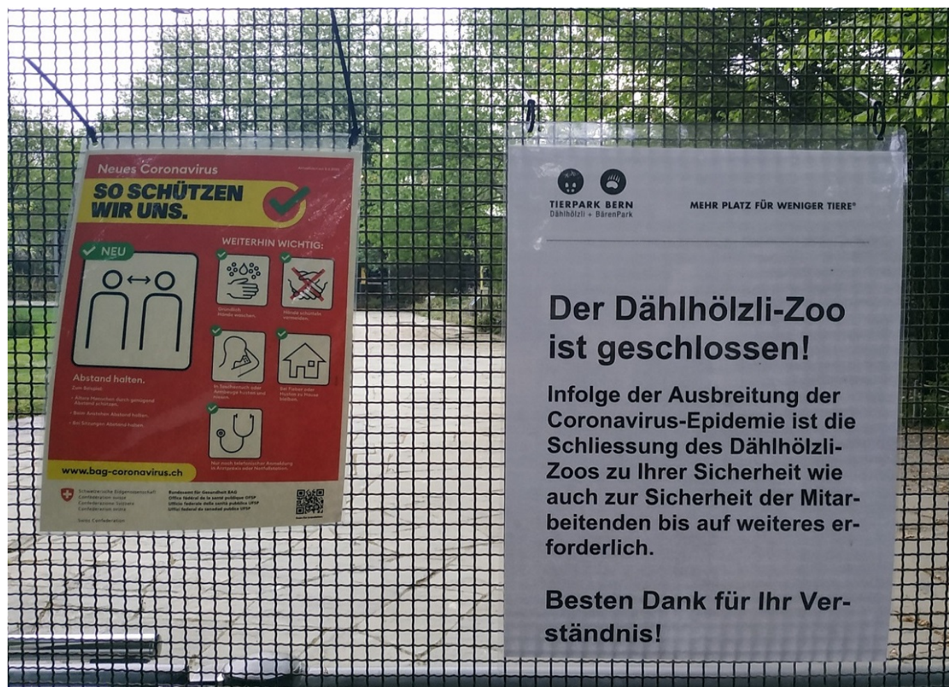
Открытия зоопарков придется ждать еще почти месяц.

Автор: Заррина Салимова, Берн , 11.05.2020.