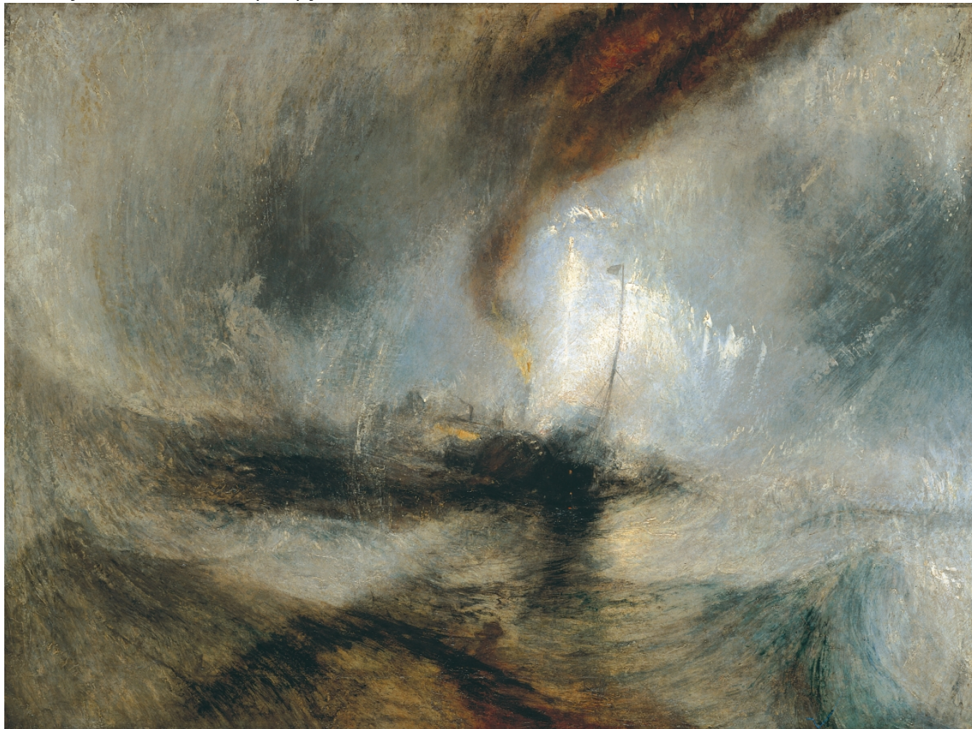
Д. М. У. Тернер. Снежная буря, 1842 г.

Старая добрая Англия открыла окно в новый мир, новую эпоху. На картине осталось место лодке, зрителям, пахарю и даже зайцу, но что все они в сравнении с этим несущимся, будто сорвавшимся с цепи временем, с белыми сгустками мазков не успевающего рассеяться пара?! Заяц и пейзаж в стиле Брейгеля уступают место поезду, двигателю, Тернеру.