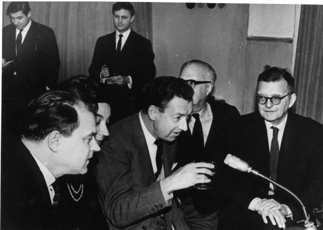
Дмитрий Шостакович и Бенджамин Бриттен в Союзе композиторов СССР, 1960-е гг.

Постоянные читатели Нашей Газеты знают, что нынешний сезон Оркестра Романдской Швейцарии проходит под знаком двух крупнейших композиторов XX века