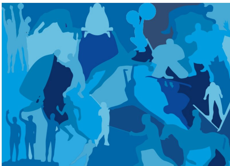
Открытка Виолы Амхерд

Глава министерства обороны и спорта, член Христианско-демократической партии (PDC) Виола Амхерд представила открытку, на которой видны силуэты спортсменов. Дизайн разработала племянница министра Лия Амхерд, раскрасив картинку в любимые цвета своей тети – от голубого до темно-синего. Внутри открытки приведены слова немецкого поэта Хорста Буллы о том, что сны и видения – это первые шаги к новому мышлению. Автор этого высказывания подчеркивает на своих страницах в соцсетях, что выступает за общество без войны и любит жизнь. Интересно, что именно министр обороны выбрала слова столь мирно настроенного человека в качестве новогоднего послания.