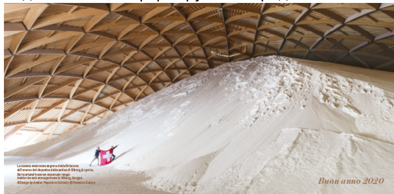
Открытка Игнацио Кассиса

Соратница Берсе по партии, глава министерства окружающей среды, транспорта, энергетики и коммуникации Симонетта Соммаруга , которая будет президентом Конфедерации в 2020 году, осталась верна себе, в очередной раз поместив на открытку фото детей – на этот раз двух трубочей. Как и раньше, речь идет о детях ее подчиненных, информирует телерадиокомпания RTS.