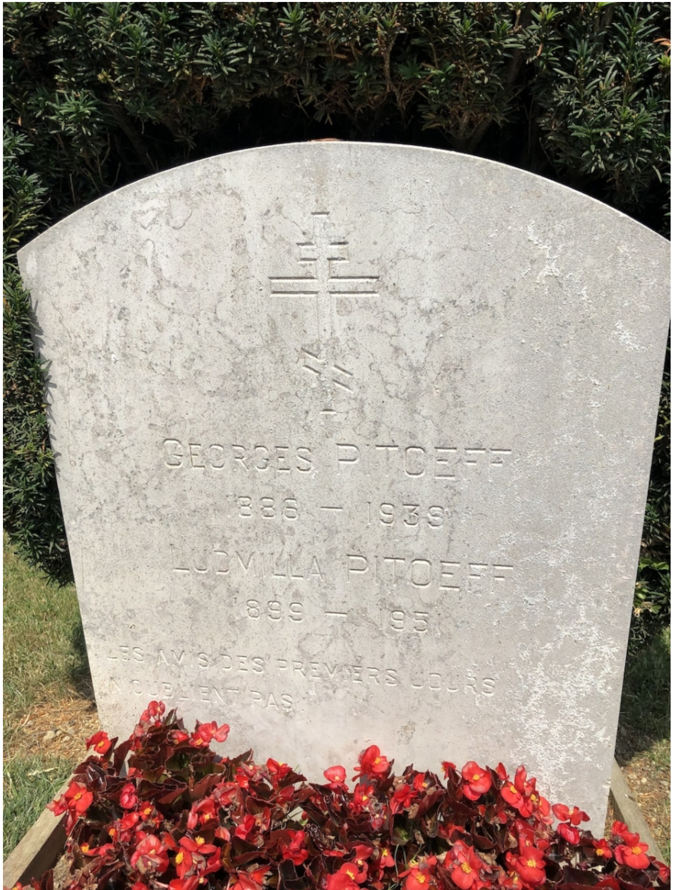
русский театр в Швейцарии Швейцария