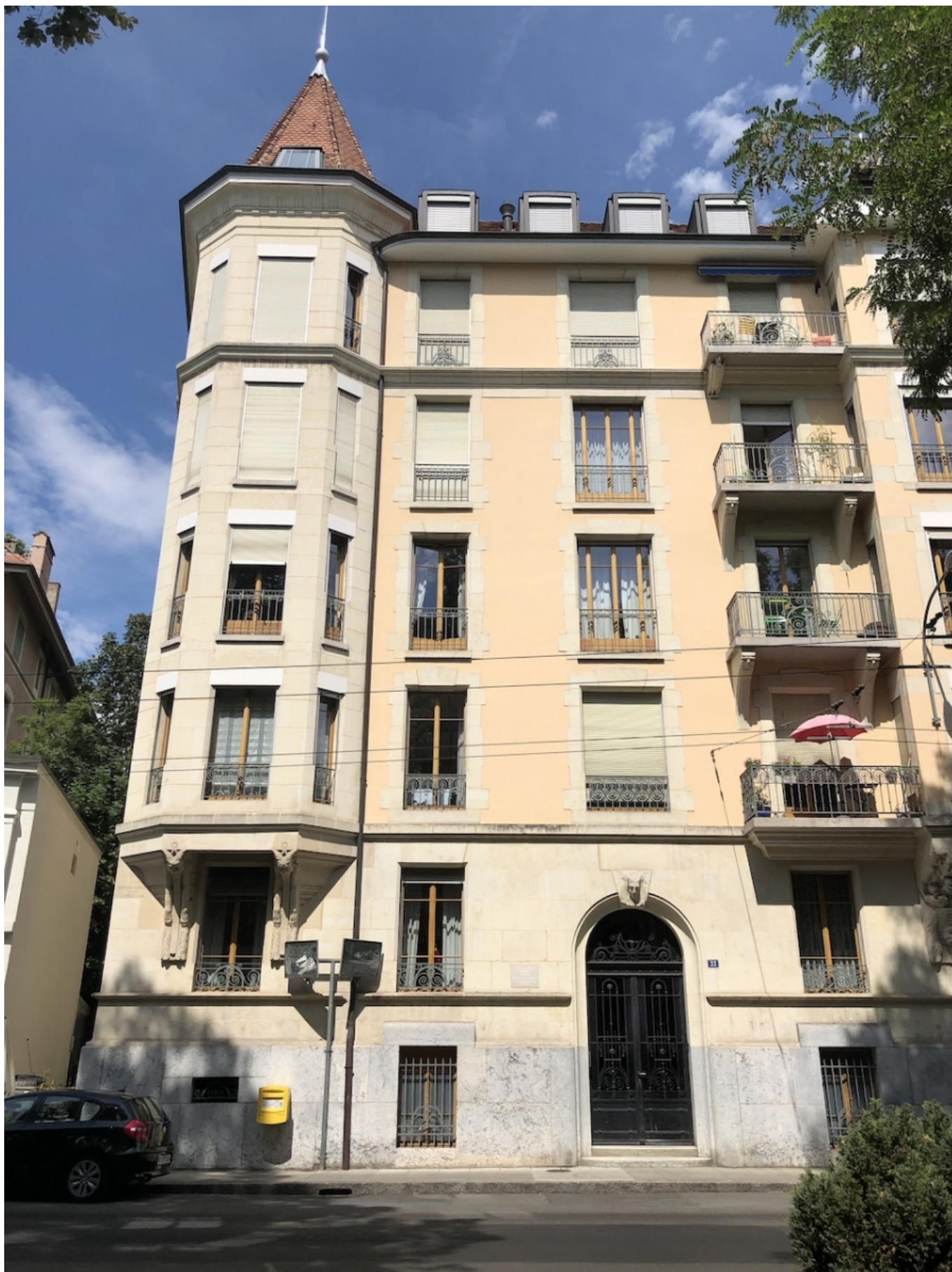
Дом в Женеве, где жили Ж. и Л. Питоевы с 1916 по 1922 гг. Avenue Miremont, 33