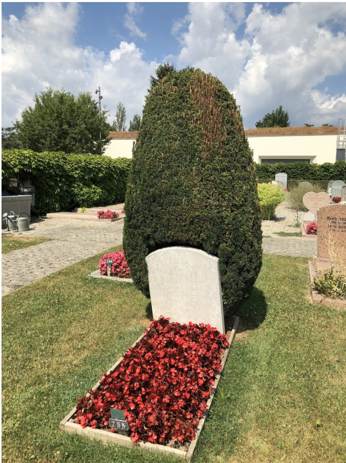
Могила Ж. и Л. Питовых в Жанто

После смерти мужа Людмила Питоева оказалась в столь сложной ситуации, что в