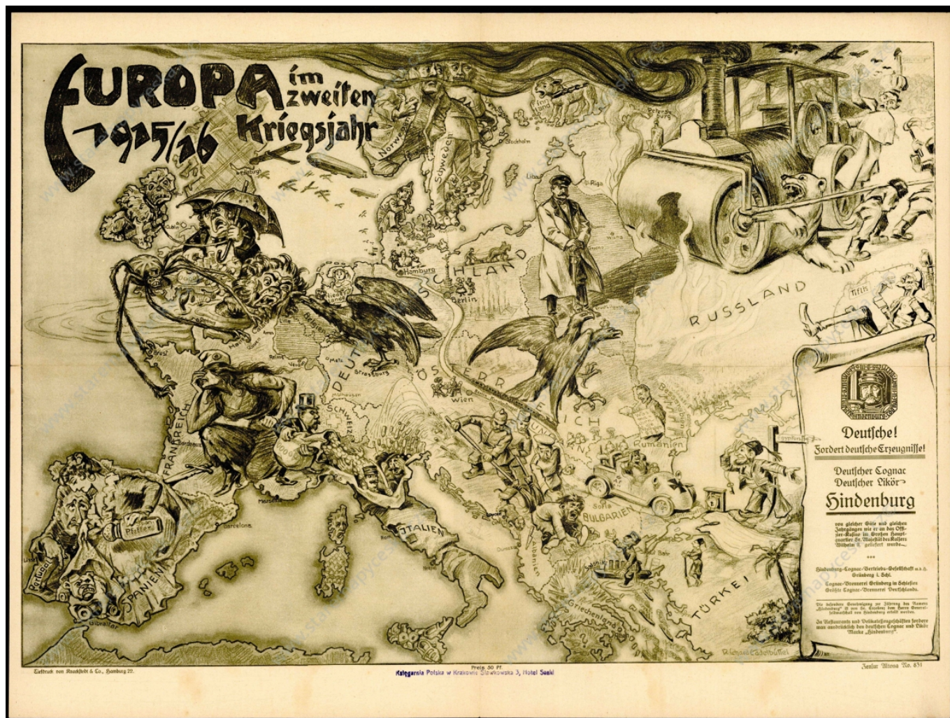
"Европа во второй год войны: 1915/16 годах"