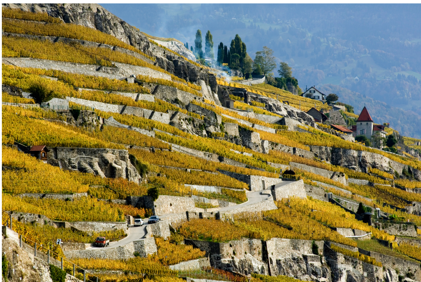
Виноградники Лаво в кантоне Во

Автор: Надежда Сикорская, Берн , 31.08.2018.