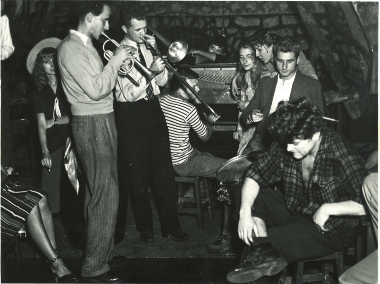
Борис Виан играет в клубе Le Tabou, 1948 год

Любовно прозванный «принцем Сен-Жермен-де-Пре», он не просто сам играл на трубе, но и преподавал джаз, писал статьи в журнал Jazz Hot , став страстным пропагандистом этой культуры. Издатель и организатор концертов, он много сделал для того, чтобы имена и музыка Майлза Дэвиса, Чарли Паркера, Диззи Гиллеспи и Бикса Бейдербека оказались у французов на слуху, в буквальном смысле слова.