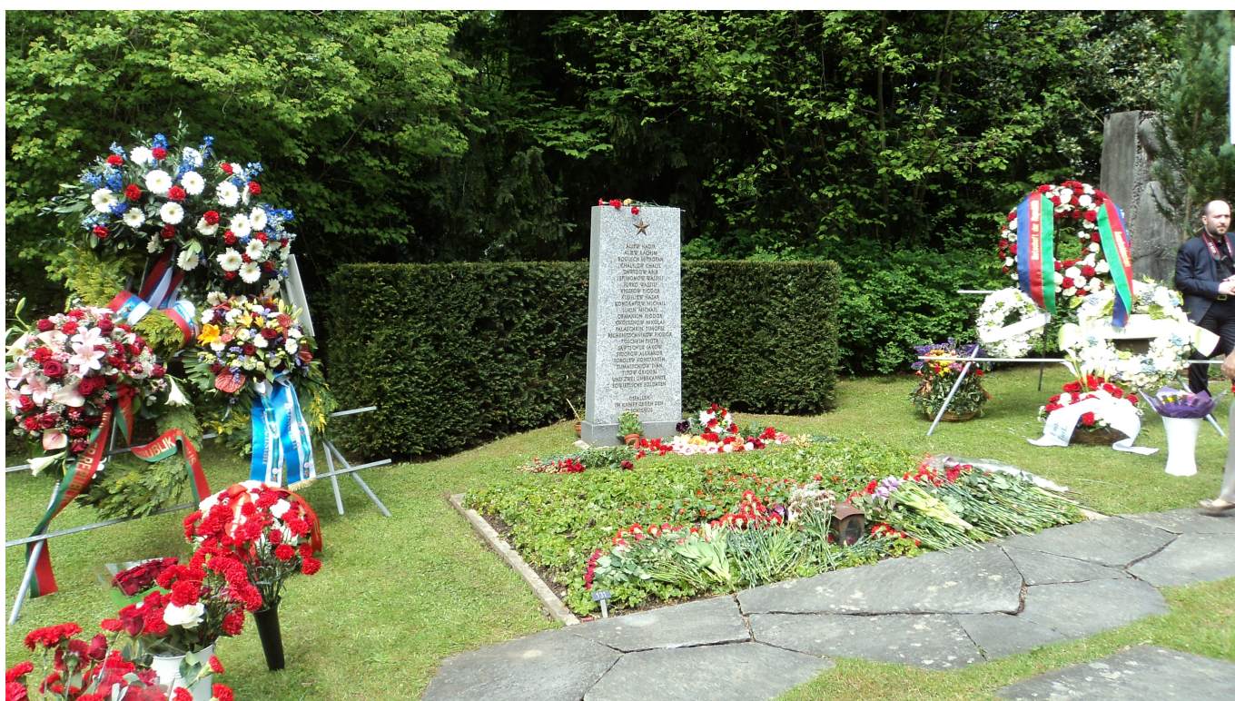
Памятник советским солдатам на кладбище Хернли в Базеле с фамилией Пшеничникова.

Автор: Иван Грезин, Базель - Bâle , 08.05.2018.