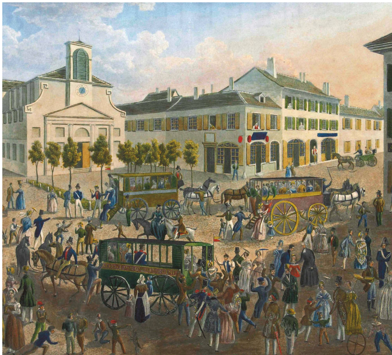
Каруж в солнечный день

Элпидин был членом женеvской секции Первого Интернационала, но существовали весьма серьезные подозрения относительно его сотрудничества с царской охранкой. В первом издании Большой советской энциклопедии он прямо заклеен как сотрудник Третьего отделения. Есть предположение, что в 1885 году он был завербован Петром Ивановичем Рачковским, главой заграничной агентуры Департамента полиции Министерства внутренних дел России, чье недремлющее око зорко наблюдало за всем происходящим в русской эмиграции. Возможно, именно высокое покровительство тайной полиции позволяло именно Элпидину публиковать запрещенные в России произведения.