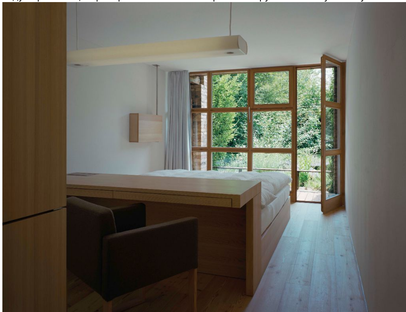
Монастырская гостиница

Неизвестно, как восприняли эту новость остававшиеся в Иттингене августинцы, чей устав значительно отличался от картезианского, но факт остается фактом: в 1471 году картезианцы приобрели обитель и построили вокруг нее высокую стену.