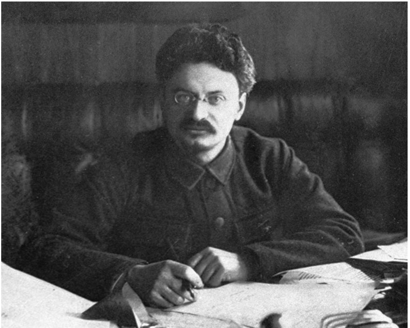
Лев Давидович Троцкий (1879-1940)