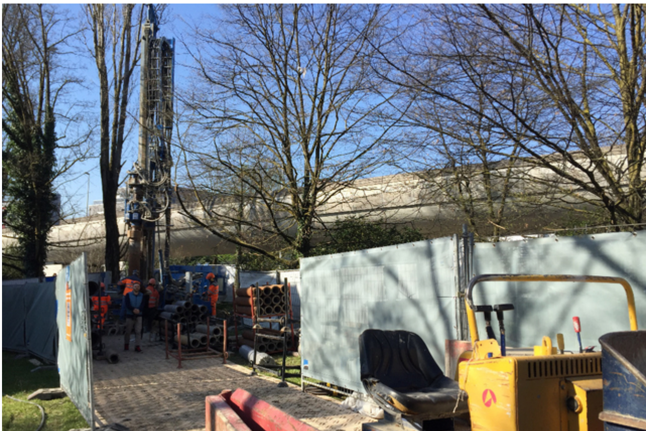
Начало работ в Вернье

Низкая рентабельность, риск землетрясений – эти факторы не должны послужить поводом для полного отказа от изучения перспектив этого направления энергетики, считают авторы исследования , проведенного Центром оценки технологического выбора TA-Swiss. Женева, власти которой активно поддерживают как словами, так и финансированием использование местных и возобновляемых («зеленых») источников энергии, в последнее время активно претворяет в жизнь свою энергетическую стратегию. Недавно мы рассказывали о том, что крыши зданий, принадлежащих кантону, будут использоваться для производства солнечной энергии. Новый проект, реализуемый в рамках кантональной программы GEothermie 2020, заключается в развитии так называемой «приповерхностной геотермии». Речь идет о грунтовых водах, которые залегают всего в нескольких десятках метров от поверхности земли.