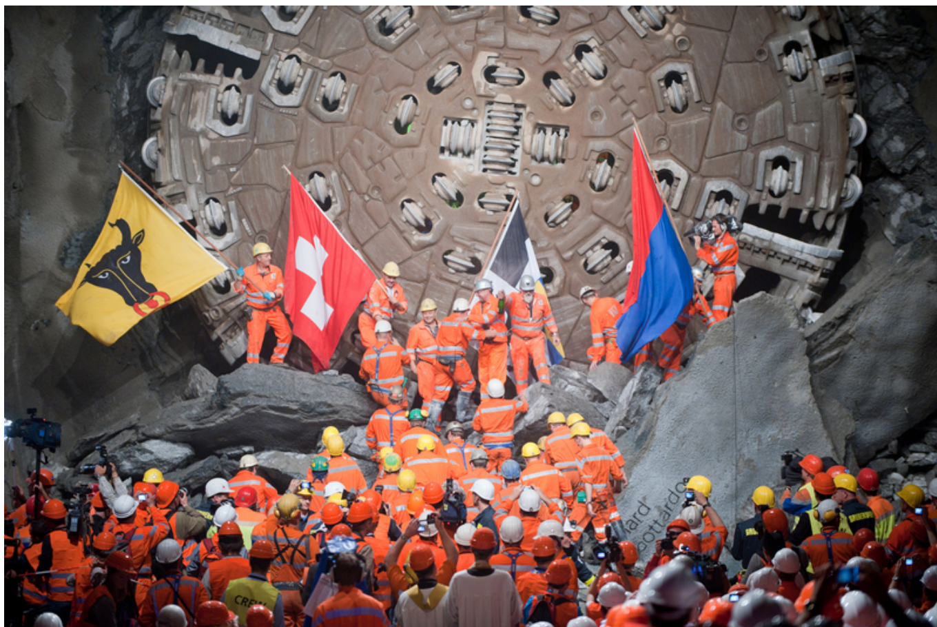
Встреча рабочих, прокладывавших туннель с севера и с юга, в 2010 году

Значение грандиозного инженерного сооружения, которое позволит сократить на полчаса (а к 2020 году – уже на час) время в пути между севером Швейцарии и итальянской частью, трудно переоценить. Напомним, что Готардский туннель является частью проекта «Новое железнодорожное сообщение через Альпы» (NLFA), основная цель которого заключается в том, чтобы перенести грузоперевозки с автомобилей на железную дорогу, защитив альпийскую природу от выхлопных газов. Эта задача касается не только Швейцарии, но и транзитного европейского трафика, поскольку Готард является важным звеном транспортного коридора, связывающего Северное море со Средиземноморьем.