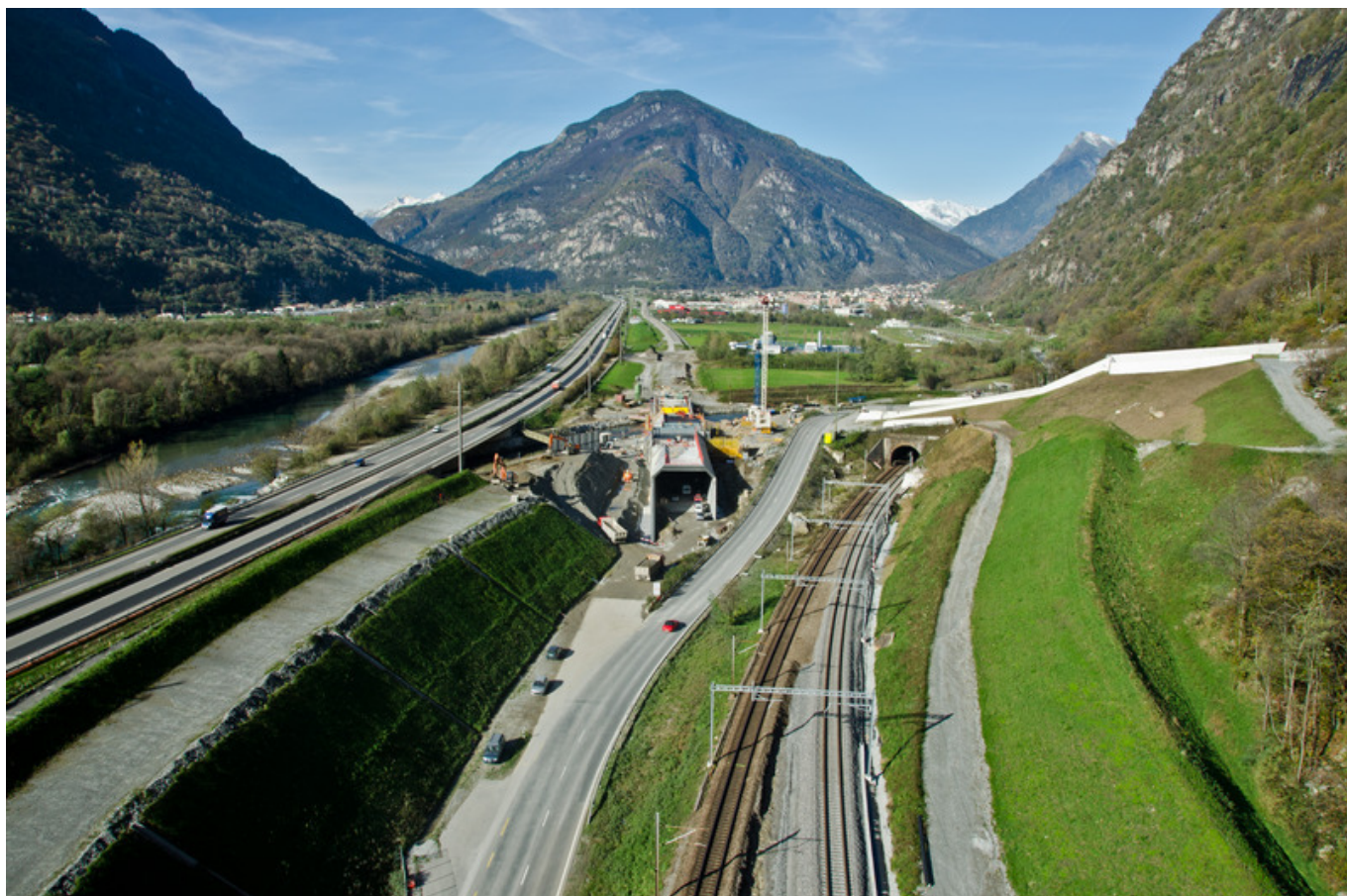
Пейзажи, по которым проходит «Новое железнодорожное сообщение через Альпы»

Напомним, что разговор с Брюсселем о предложенной швейцарским правительством « защитной оговорке » состоится не раньше 23 июня, на которое в Великобритании намечен референдум о выходе из ЕС, а Соглашение о свободном перемещении граждан, на изменении которого настаивает Швейцария, идет в одном пакете с Соглашением о наземном транспорте, распространяющемся, в том числе, и на железнодорожные перевозки.