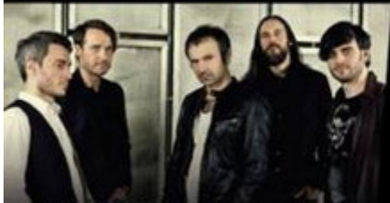
ОКЕАН ЕЛЗИ акустика

Ханс-Хубер-Зал Штайненберг 14, 4051 Базель