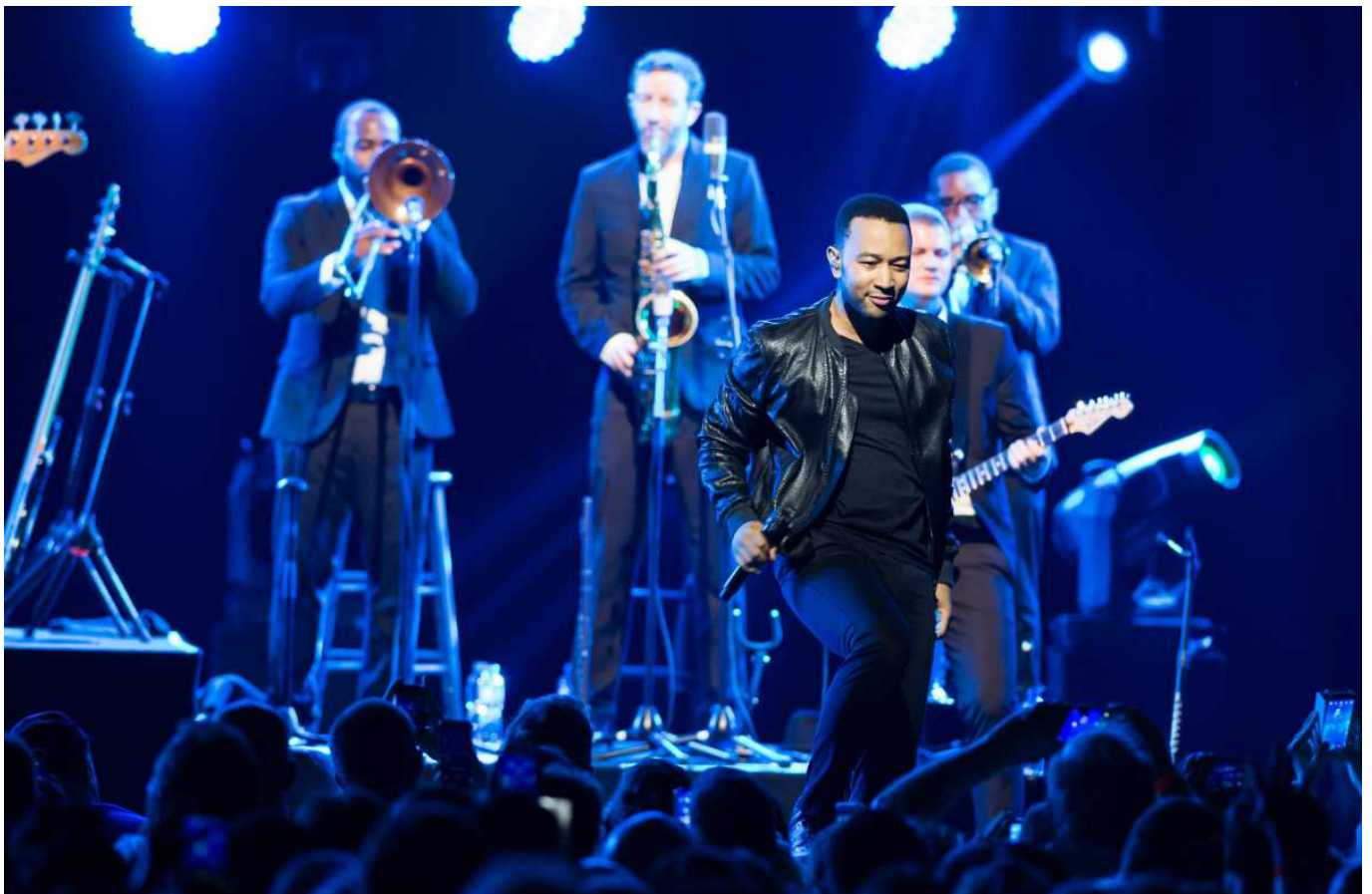
Джон Ледженд

Когда он вышел на сцену в черной кожаной куртке, зал ахнул: при почти сорокоградусной жаре такой шаг казался почти геройским. Первые четыре песни разогрели публику еще сильнее, а затем настал момент, который музыкант продумал заранее. Под гитарное интро он стал медленно снимать с себя куртку, и визги юных поклонниц и их мам наполнили зал. Причем последних было слышно лучше, что неудивительно, ведь основные поклонники фестиваля – люди за 40: в большинстве своем только они могут себе позволить билеты на концерты в Auditorium Stravinski.