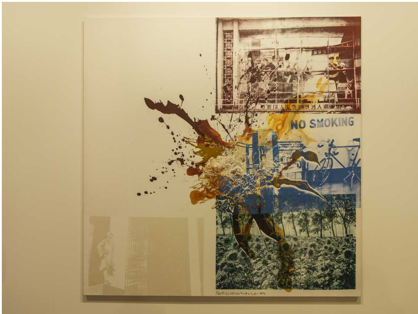
Роберт Раушенберг «Lace Hunt» (© Andrey Fedorchenko)