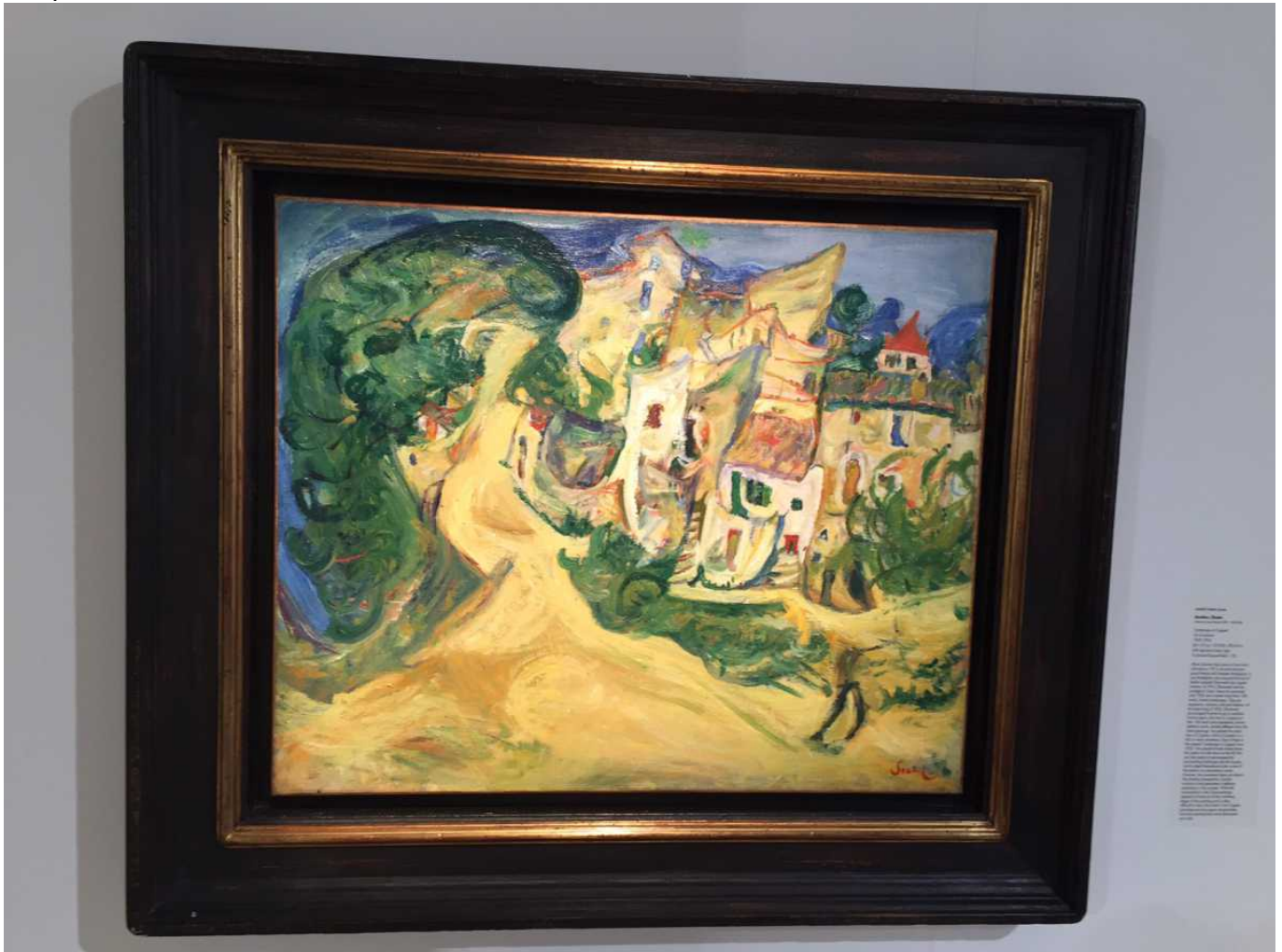
Хаим Сутин "Пейзаж в Кане", Галерея Томас, Мюнхен