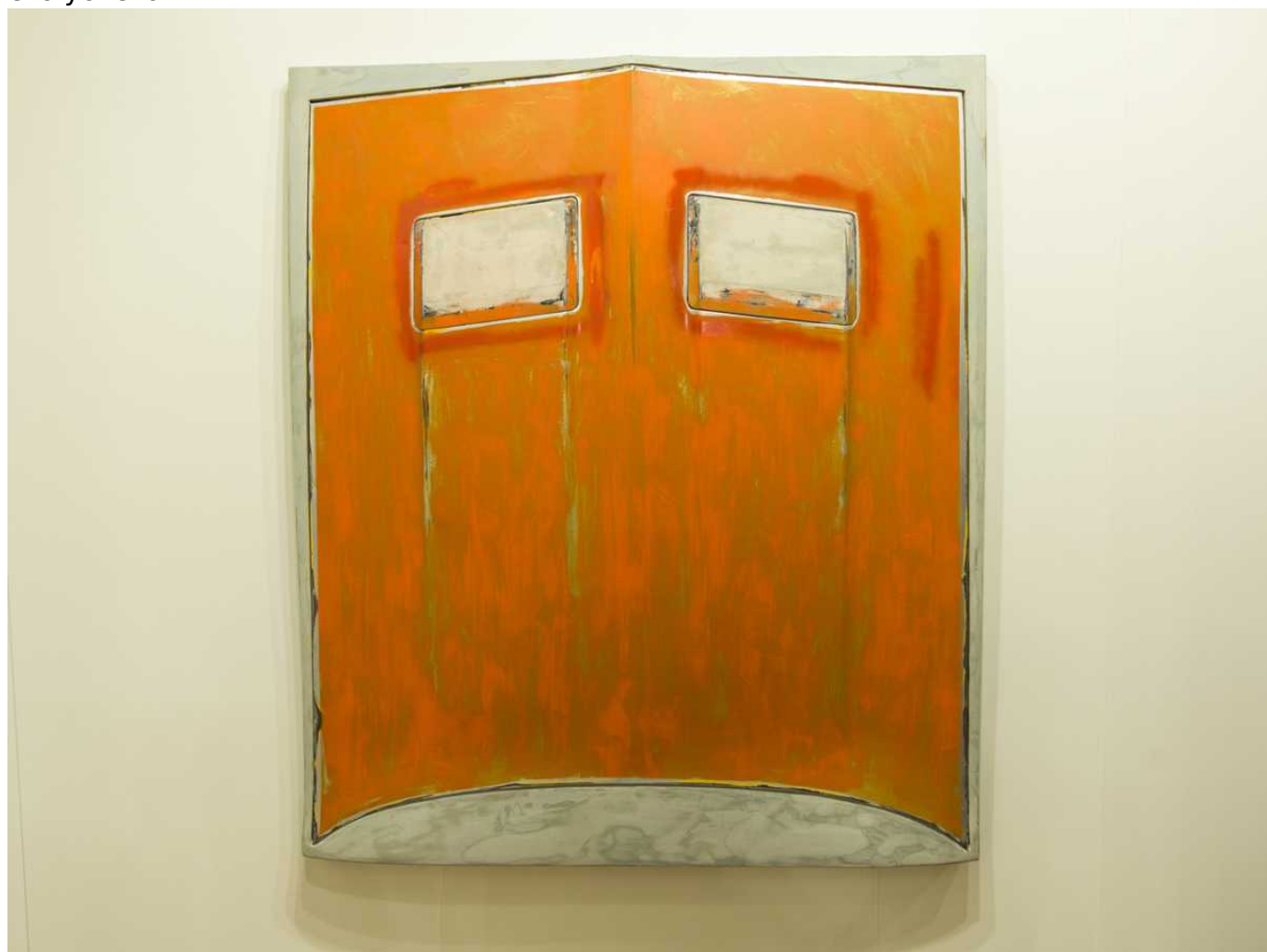
У Гагосяна картины не подписывают

Когда говорят о self-made man (человеке, сделавшем самого себя), на ум сразу приходят старинные байки о нуворишах, ночующих на пути к успеху в картонных коробках, с единственным жизненным принципом: купи дешевле, продай дороже! Однако именно таков Ларри Гагосян, основавший первую из двенадцати своих галерей еще в конце 70-х годов минувшего века. Он занимает второе место в списке «100 самых влиятельных деятелей мира искусств» по версии «ArtReview». Начинал Гагосян с продажи плакатов, которые покупал за 2 доллара, а продавал за 15. Сегодня его коллеги утверждают, что Гагосян может купить картину за 1000 долларов, а продать за миллион. Имеет чрезвычайно острый нюх на таланты. Так, первый крупный успех пришел к Гагосяну, когда он открыл в начале 80-ых Жана-Мишеля Баския, граффитчика, рисовавшего на нью-йоркских улицах. Сегодня полотна Баския – одни из самых дорогих в мире. Специализация Gagosian Gallery – современное искусство. От Джеффа Кунса до Дэмьена Херста, к слову, открытых также Ларри Гагосяном. Деловая хватка и отменный художественный вкус – залог его успеха.